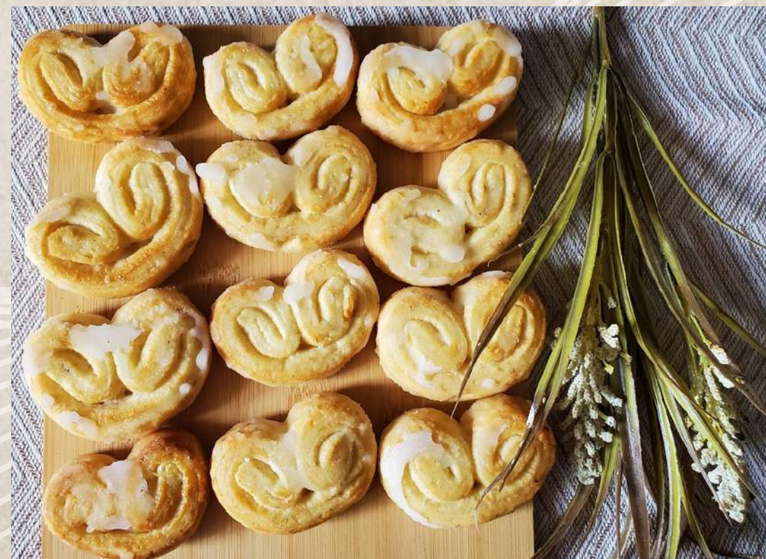
PALMERITAS ARTESANAS GLASEADAS - (80 UDS. EN 4 BANDEJAS DE 20 UDS) COD. 2455