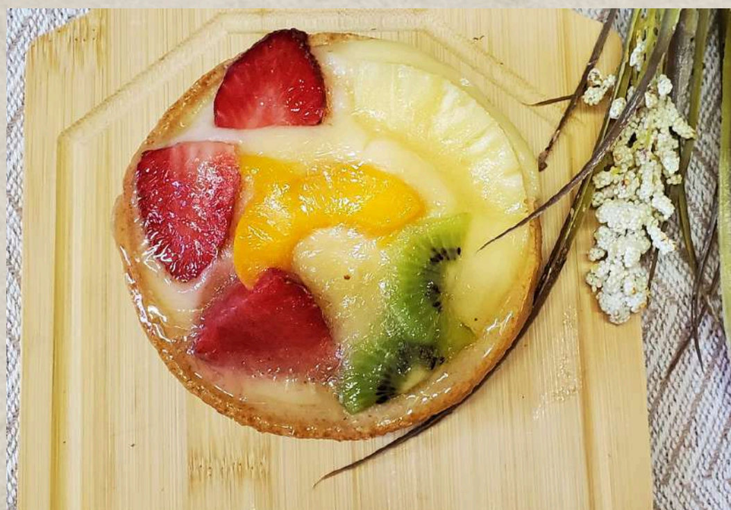
TARTELETA DE FRUTA