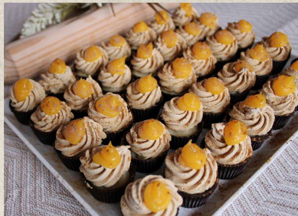
PETIFOURS CARAMELO (BANDEJA)