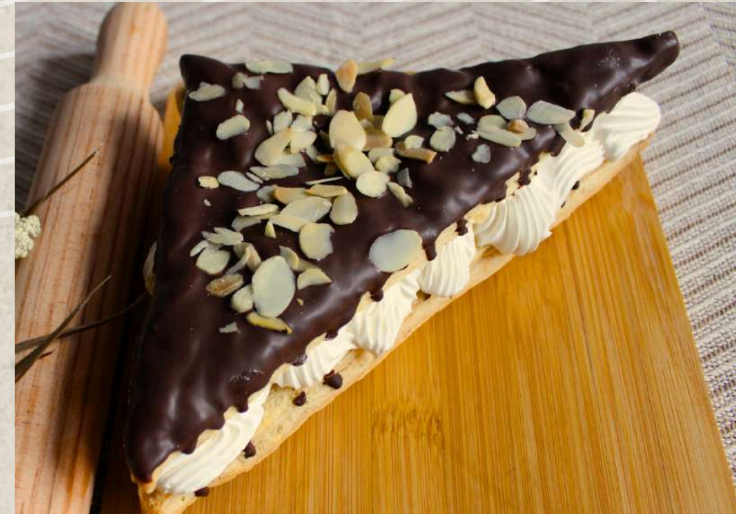
TRIÁNGULO DE CHOCOLATE COD. 134