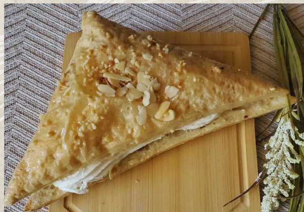
TRIÁNGULO DE NATA Y AZÚCAR COD. 135