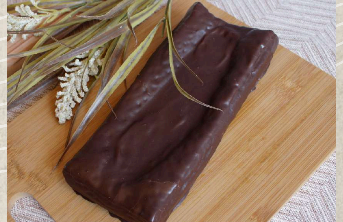
LARGOS DE CHOCOLATE COD. 213