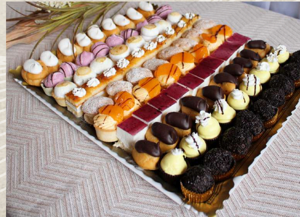
PASTELES SURTIDOS (BANDEJA 2 KG) COD. 520