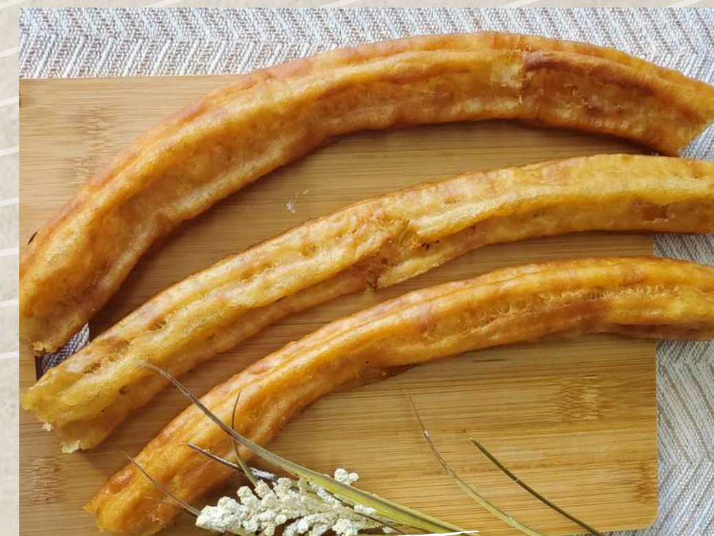
PORRAS COD. 150