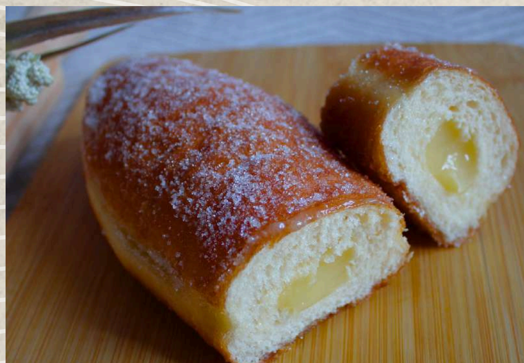
PEPITO FRITO COD. 116