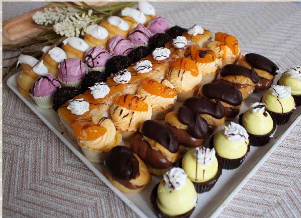
PASTELES SURTIDOS (BANDEJA 1 KG) COD. 331