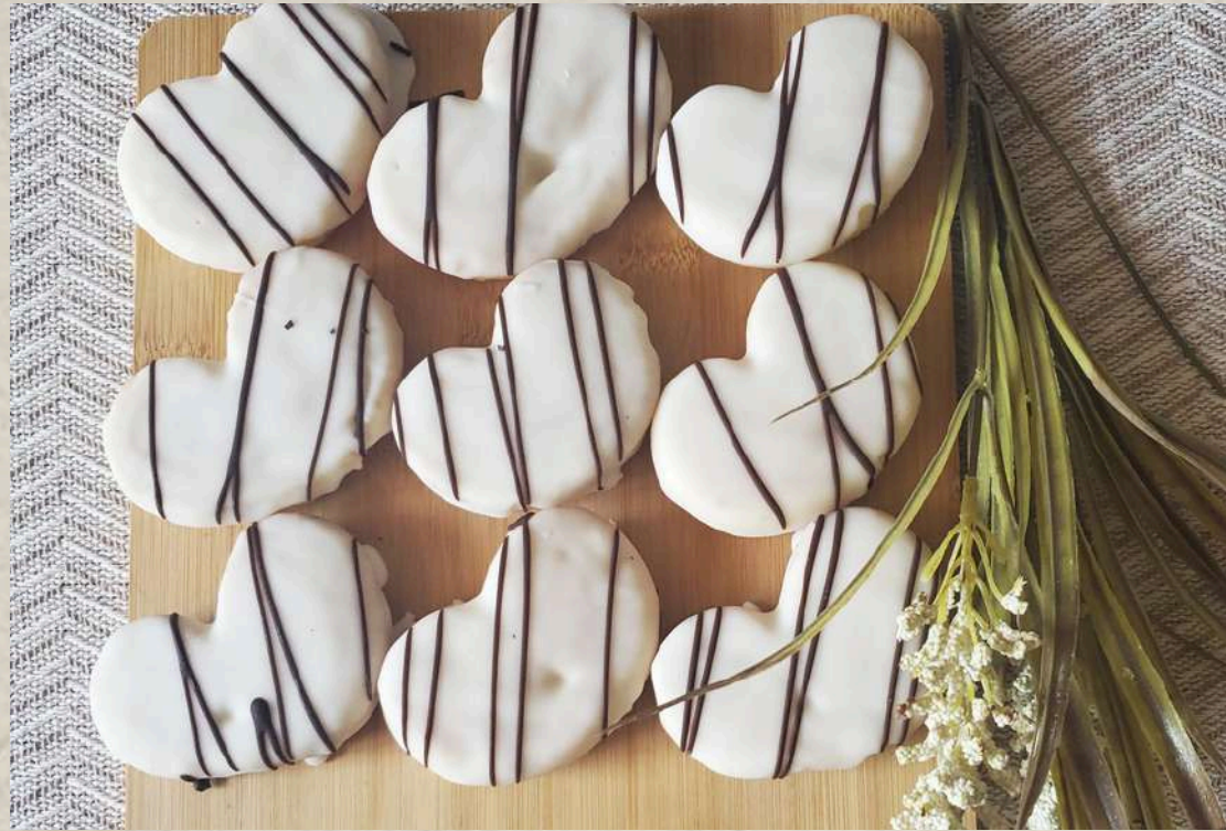
PALMERITAS ARTESANAS CHOCOLATE BLANCO CAJA DE 20 UNIDADES COD. 2454