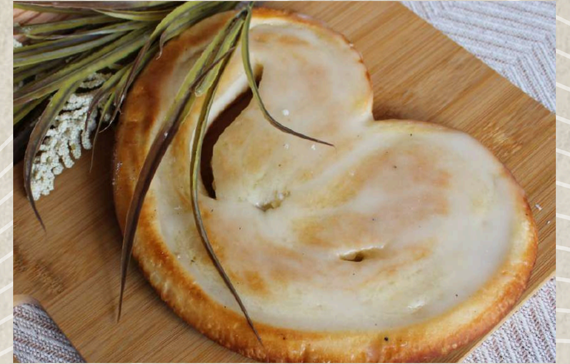
PALMERA GLASEADA COD. 201