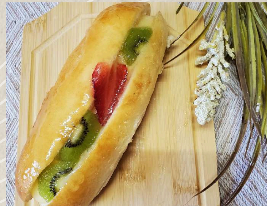
CARMELITA FRUTA Y CREMA