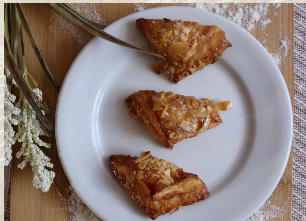
PAÑUELO MINI COFFEE