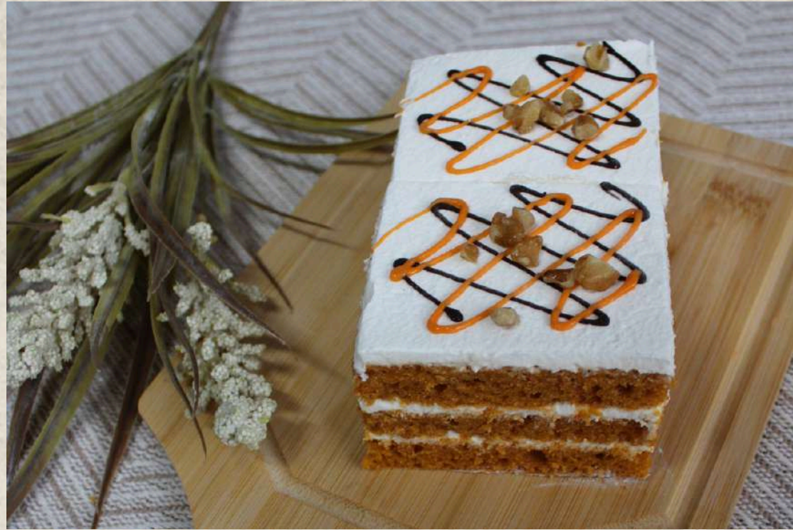
POSTRES DE ZANAHORIA (BANDEJA 4 UD.)