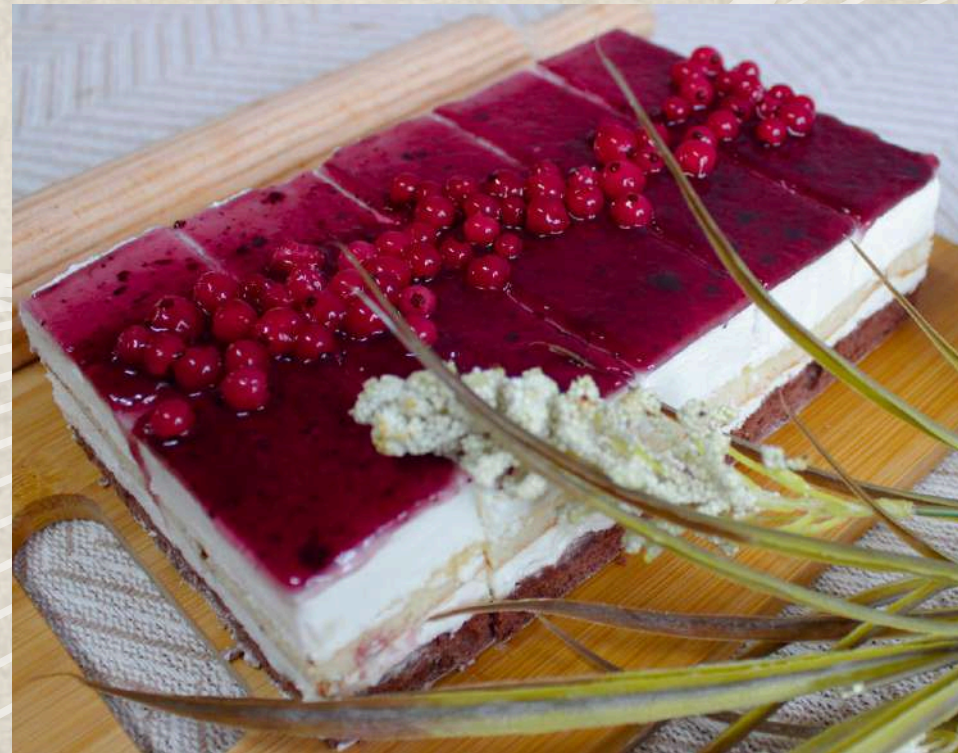
POSTRES MOUSSE QUESO Y FRAMBUESA (BANDEJA 5 UD.)