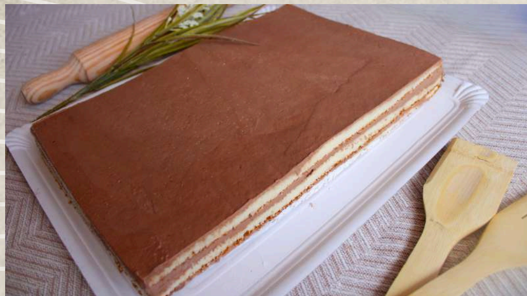
TARTA DE RESTAURANTE TIRAMISÚ COD. 0267