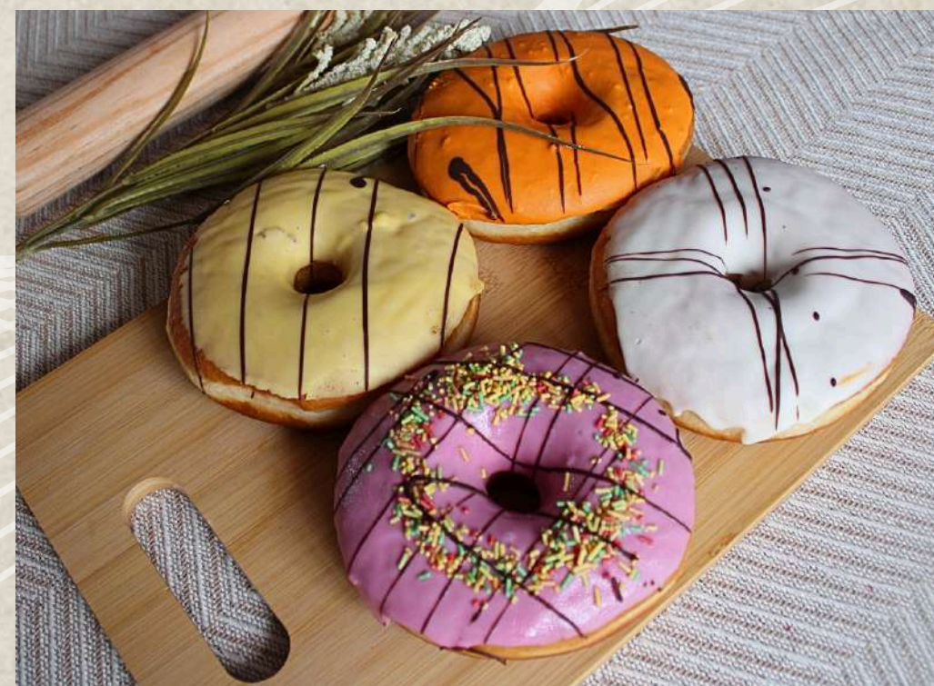
ESTUCHE 4 BERLINAS DE COLORES