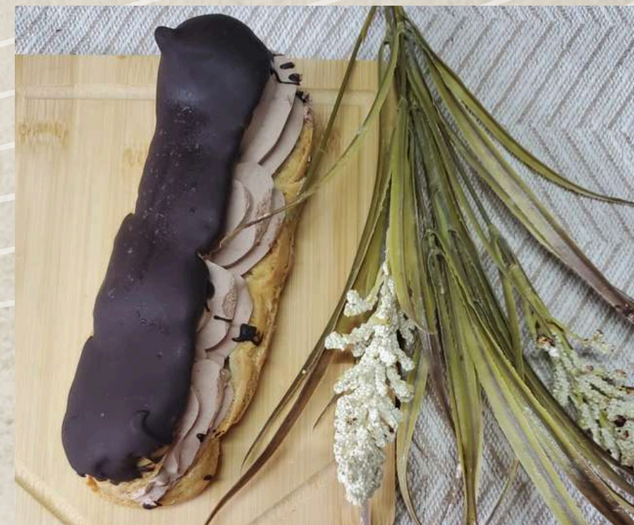
PALO DE TRUFA