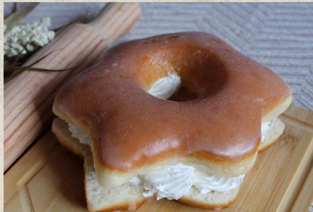
ESTRELLA AZÚCAR GLAS Y NATA COD. 180