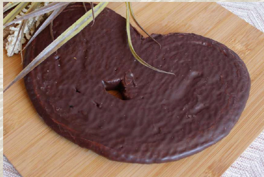
PALMERA DE CHOCOLATE COD. 202