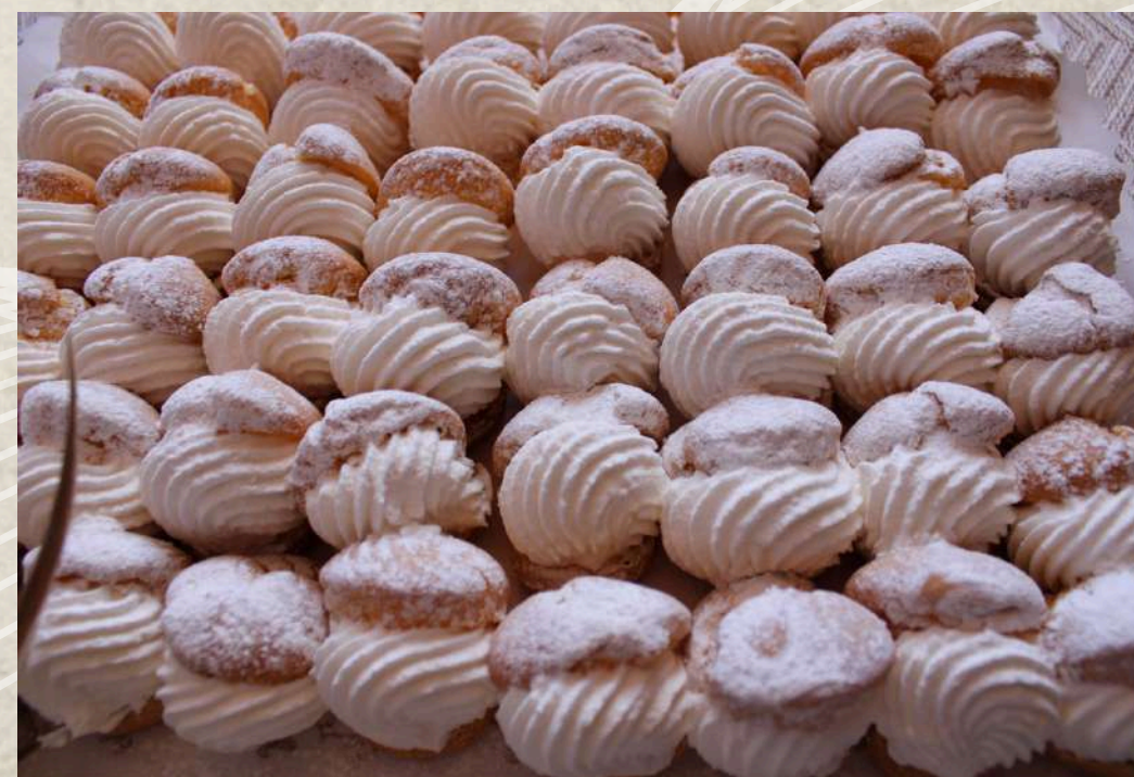
BOCADITOS DE NATA (BANDEJA)