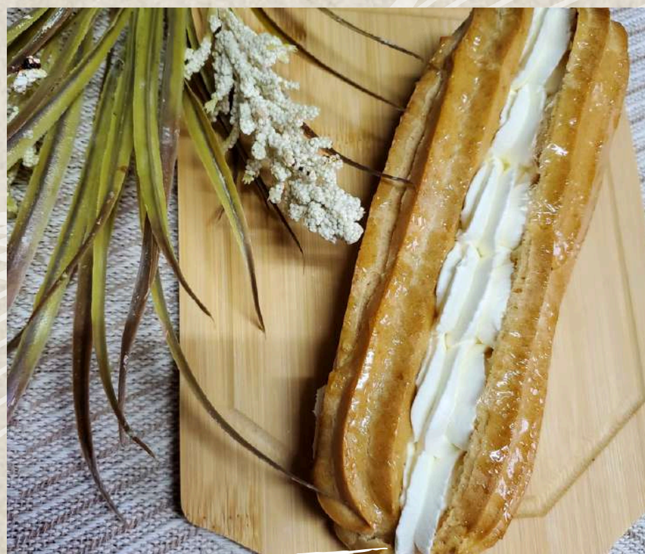
PALO DE NATA