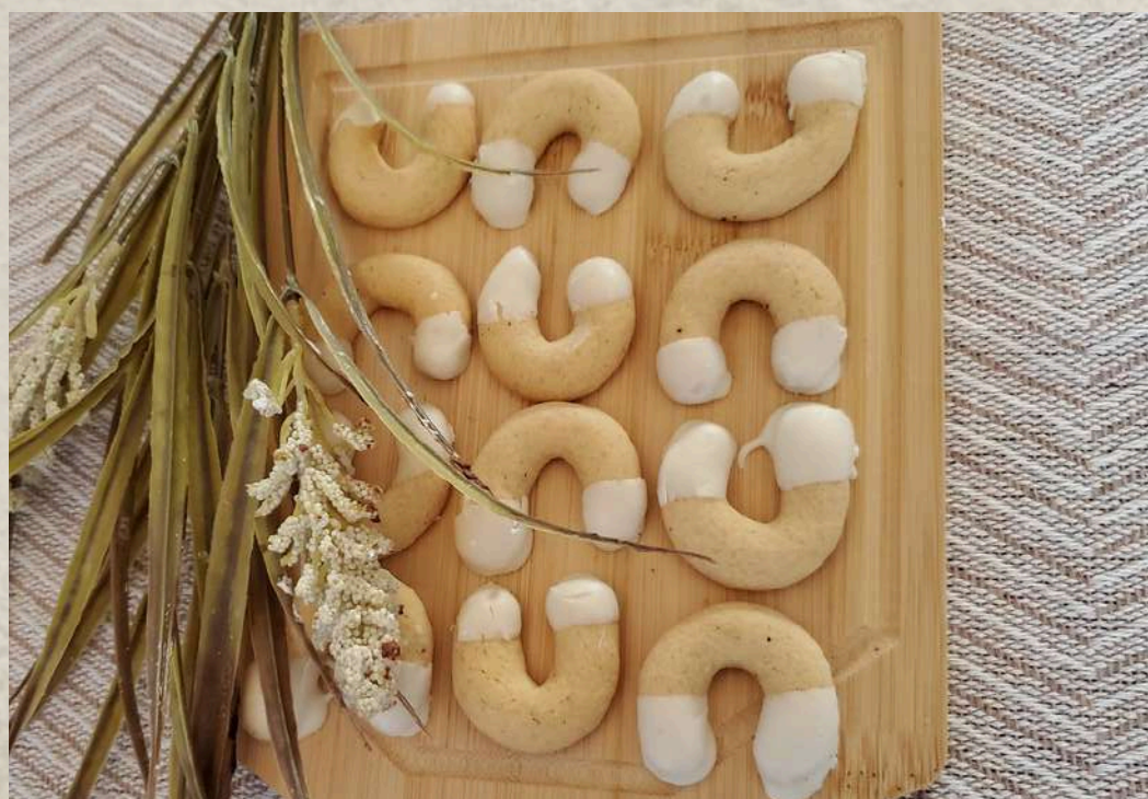
PASTAS TIPO 1 (BANDEJA 1 KG.)