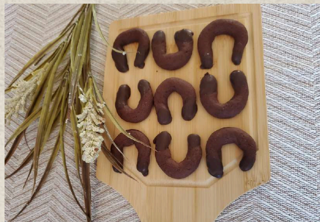
PASTAS TIPO 2 (BANDEJA 1 KG.)