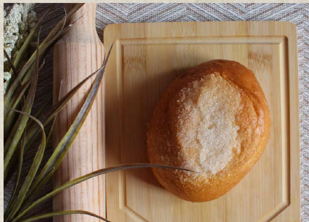
SUIZO MEDIANO COD. 171