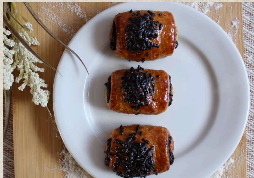
NAPOLITANA CHOCOLATE MINI