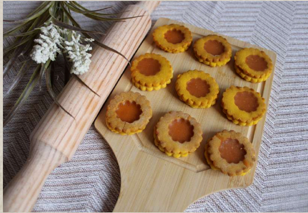
PASTAS TIPO 14 (BANDEJA 1 KG.)