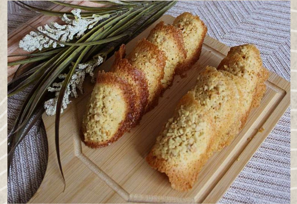
TEJAS ALMENDRADAS (KG.) COD. 353