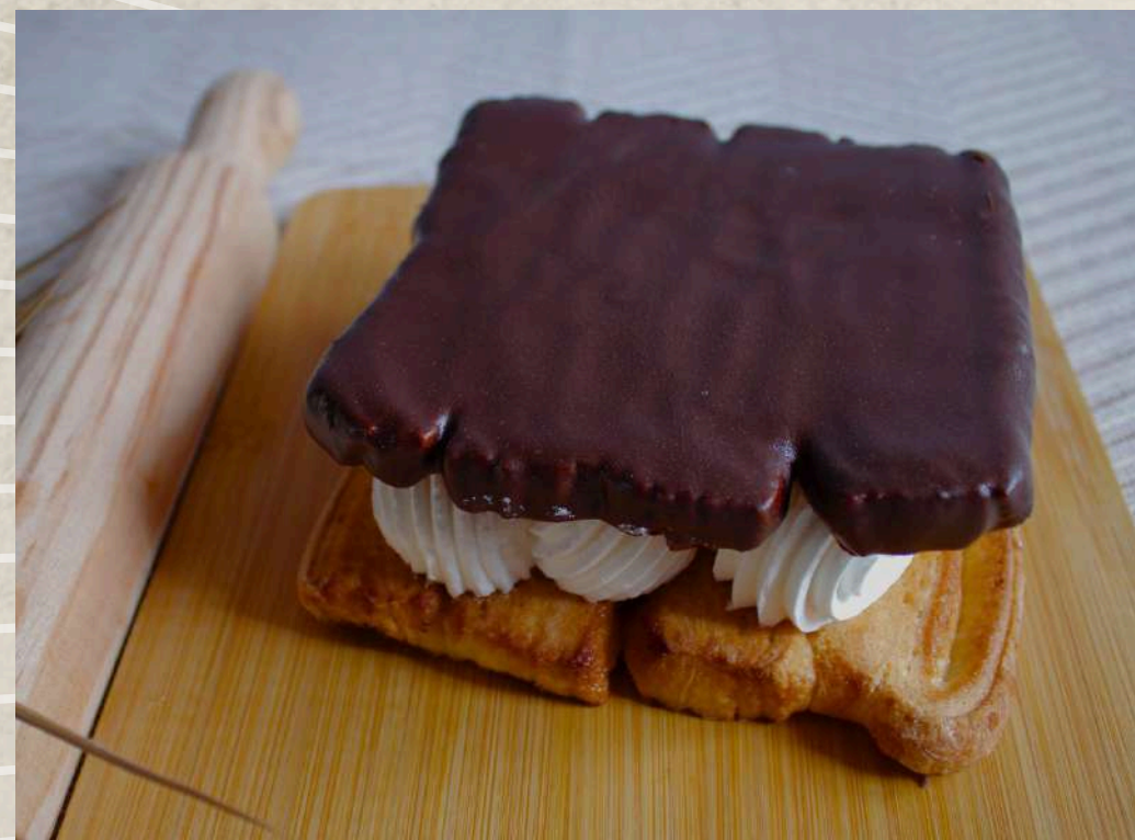
CRUNIS DE CHOCOLATE Y NATA COD. 168