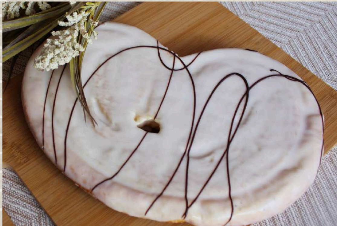
PALMERA CHOCOLATE BLANCO COD. 217