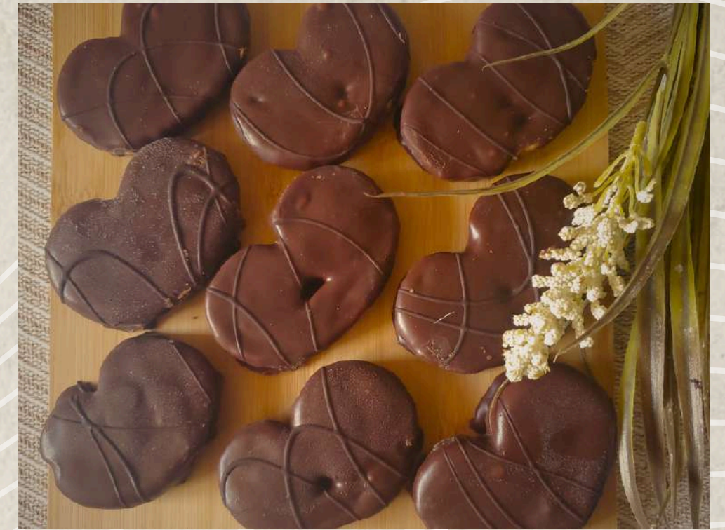
PALMERITAS ARTESANAS BOMBÓN CAJA DE 20 UNIDADES COD. 2451