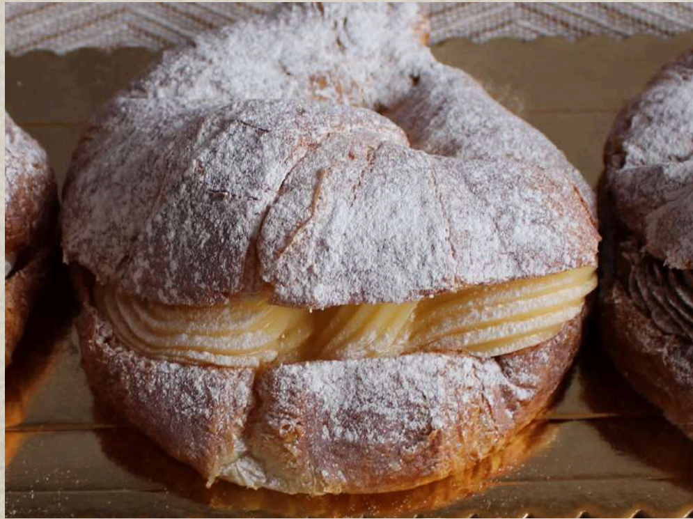
CROISSANT RELLENO CREMA