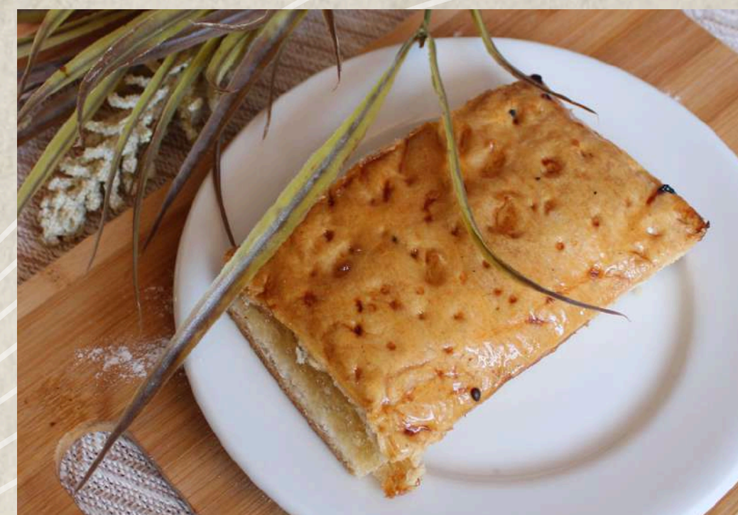
BAYONESA COD. 204