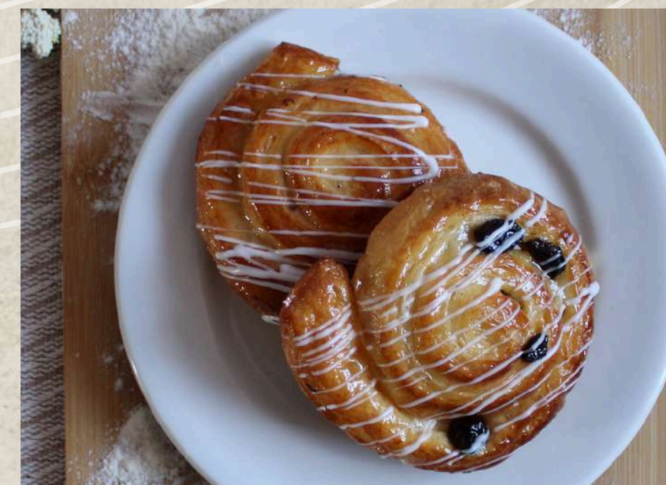
CARACOLA MEDIANA COD. 174