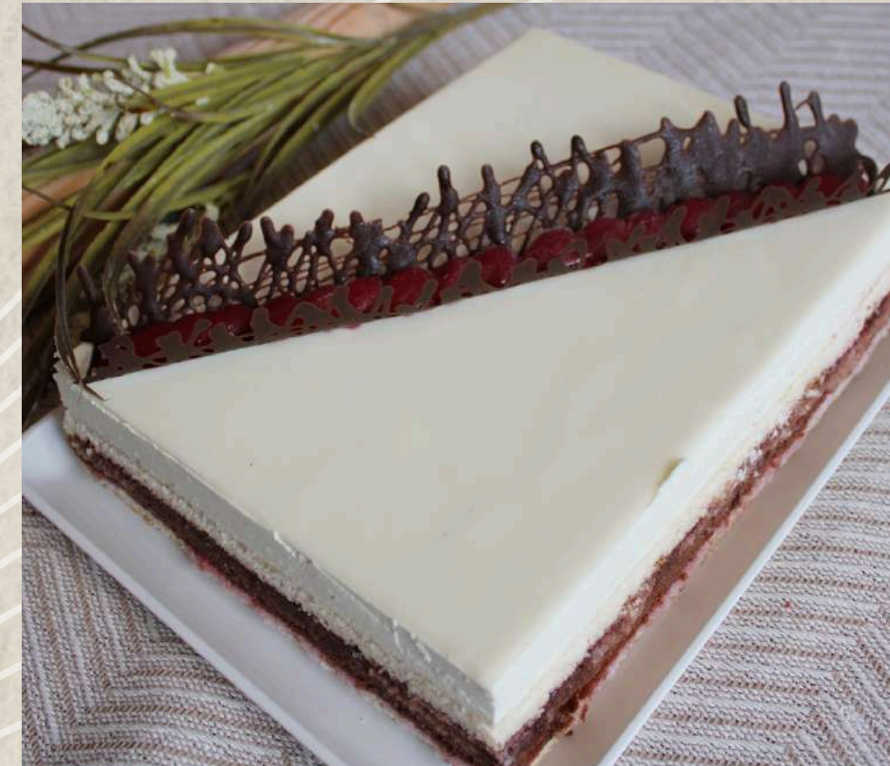
TARTA SACHER BLANCA

DISPONIBLE EN 6, 9, 12, 18 Y 24 RACIONES