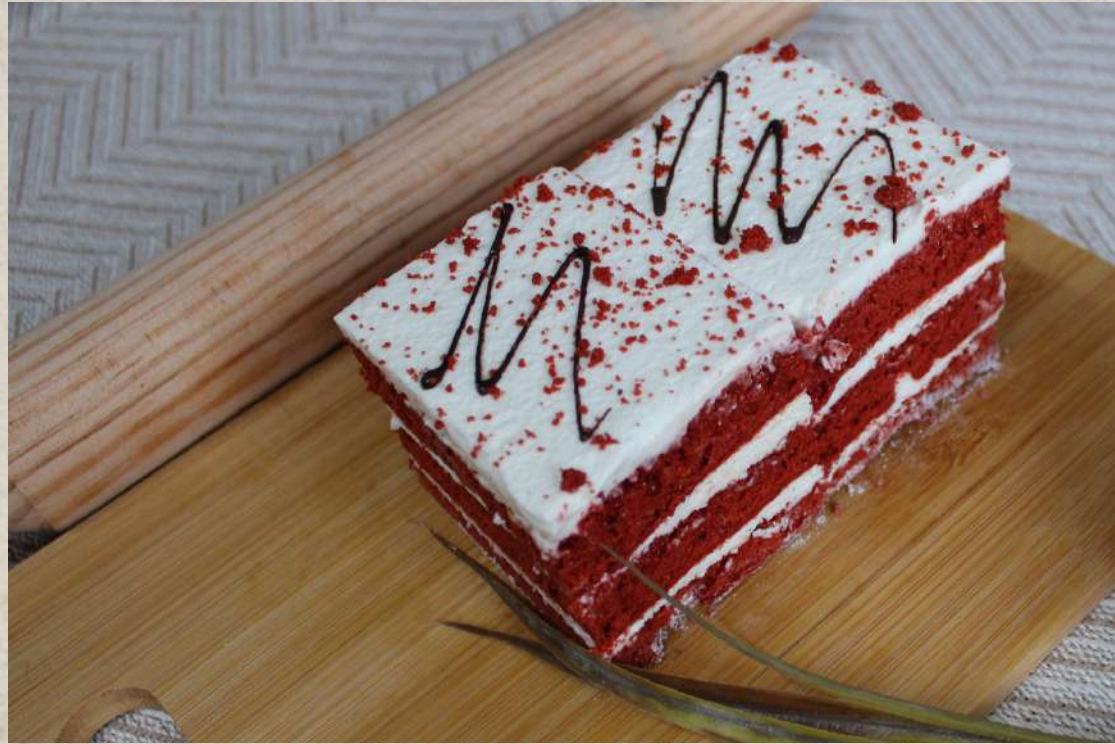
POSTRES DE RED VELVET (BANDEJA 4 UD.)