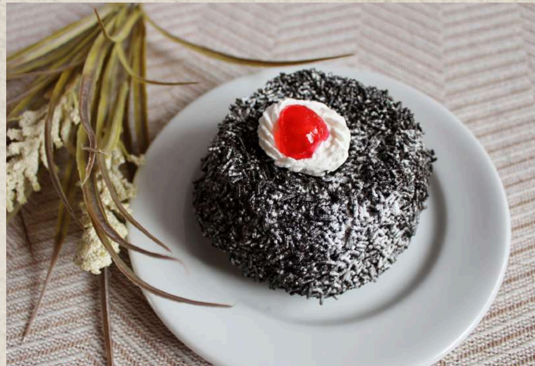
TARTITAS DE CHOCOLATE