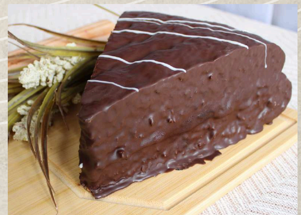
CUÑAS DE CHOCOLATE