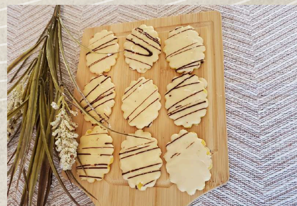
PASTAS TIPO 7 (BANDEJA 1 KG.)