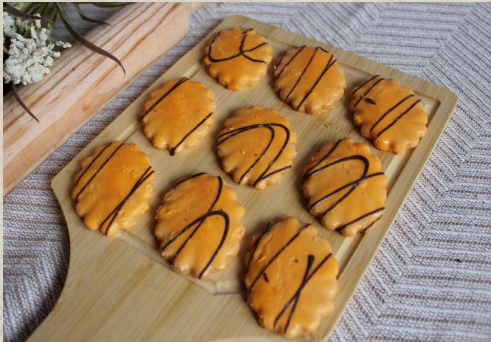
PASTAS TIPO 8 (BANDEJA 1 KG.)