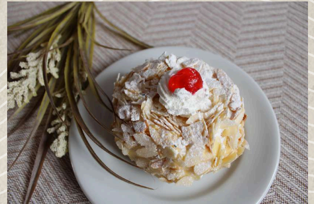
TARTITAS DE ALMENDRA