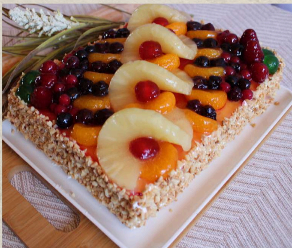
TARTA DE HOJALDRE Y FRUTAS