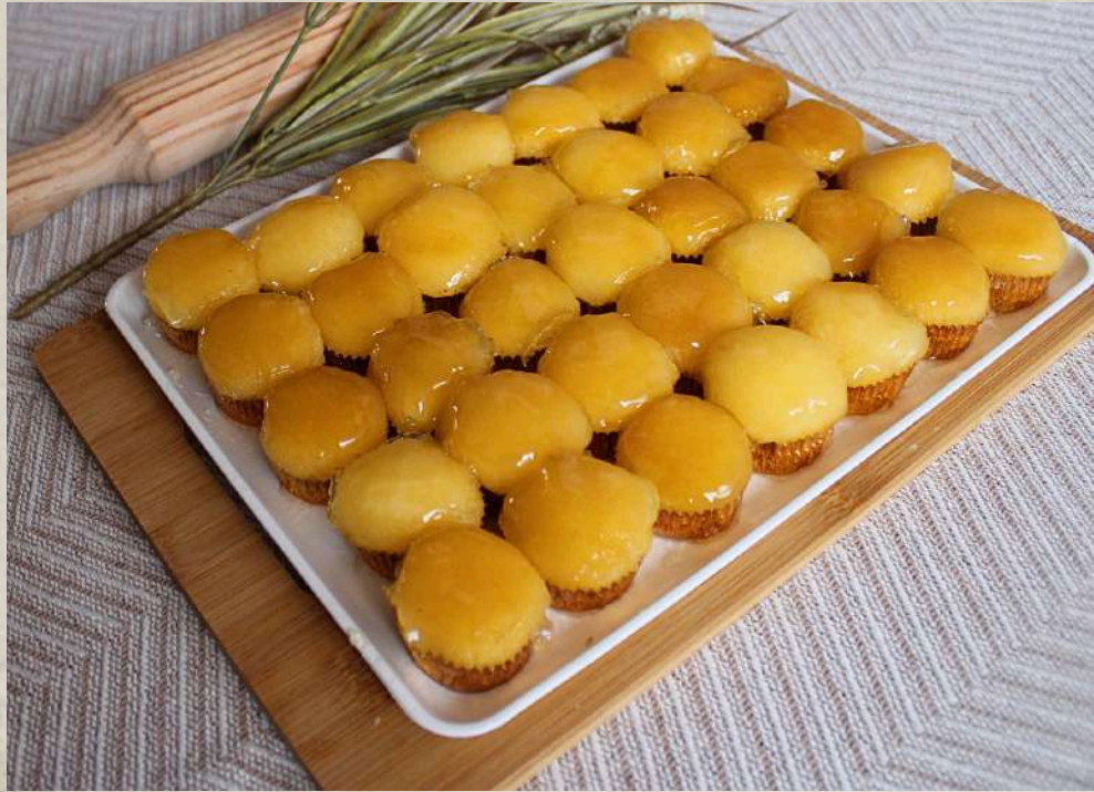
BOCADITOS AL RON (BANDEJA)