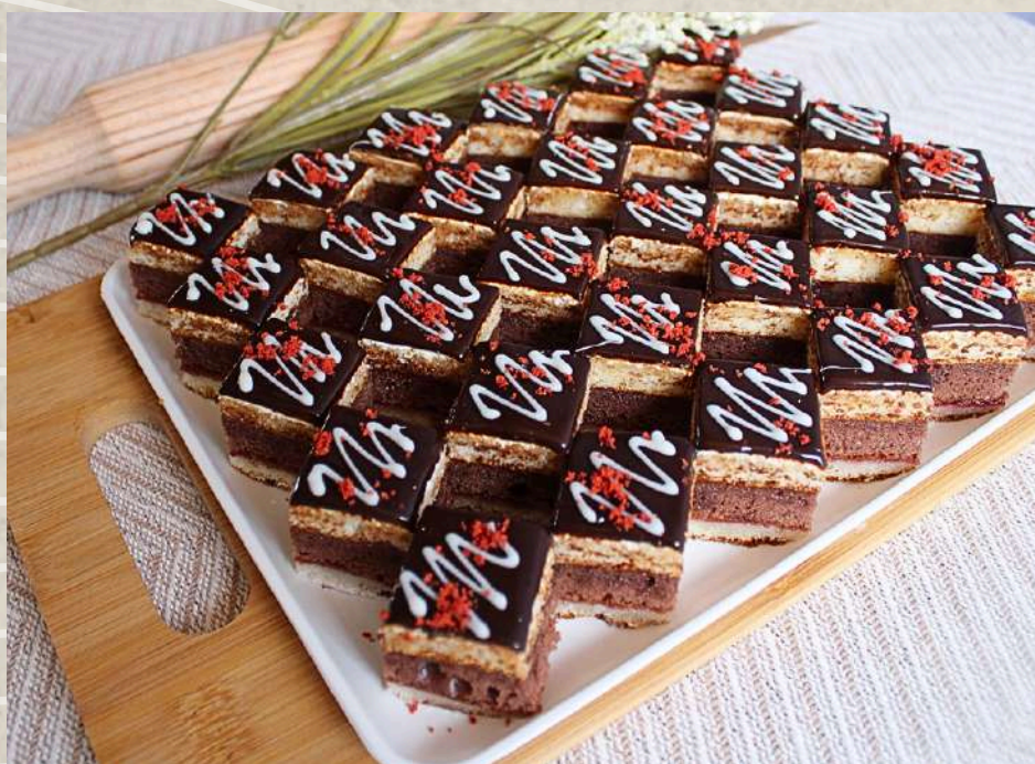
BIZCOCHO DE CHOCOLATE (BANDEJA)