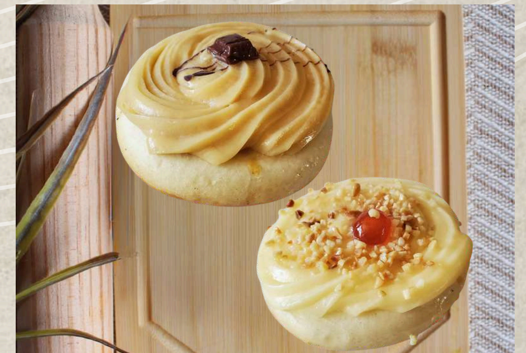
BERLINES DE CHOCOLATE