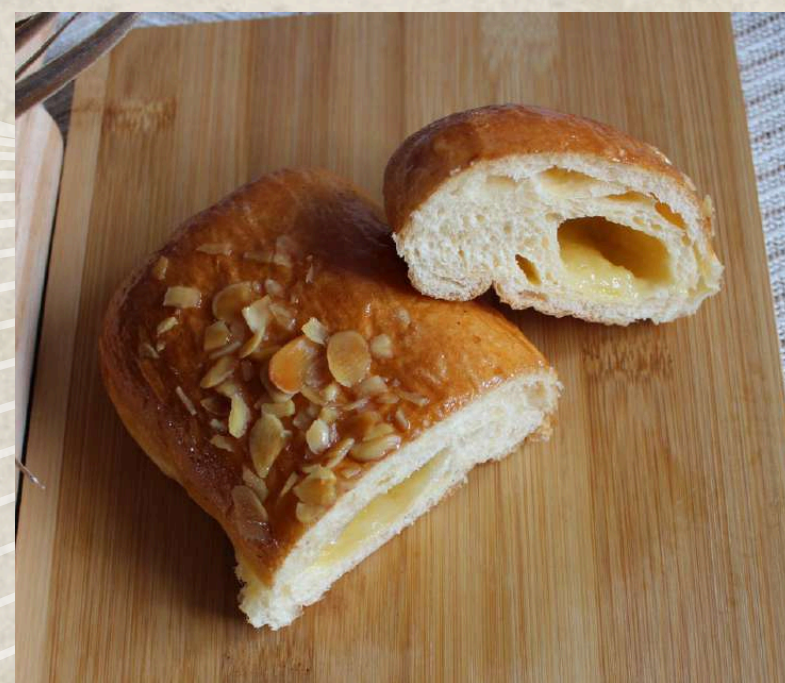
NAPOLITANA MEDIANA CREMA COD. 176