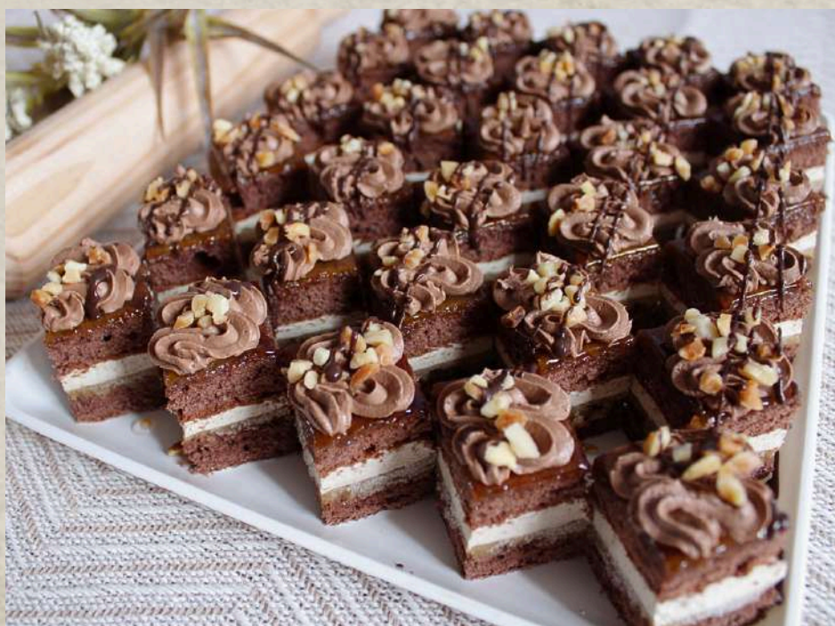
PASTELES TIRAMISÚ (BANDEJA)