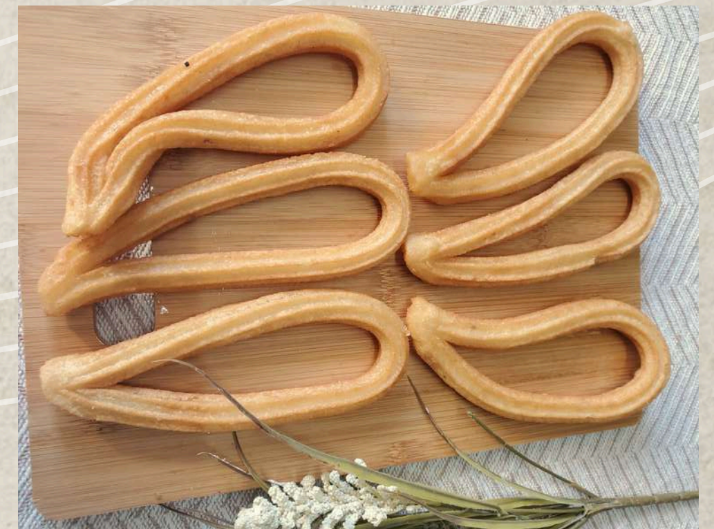
CHURROS COD. 151