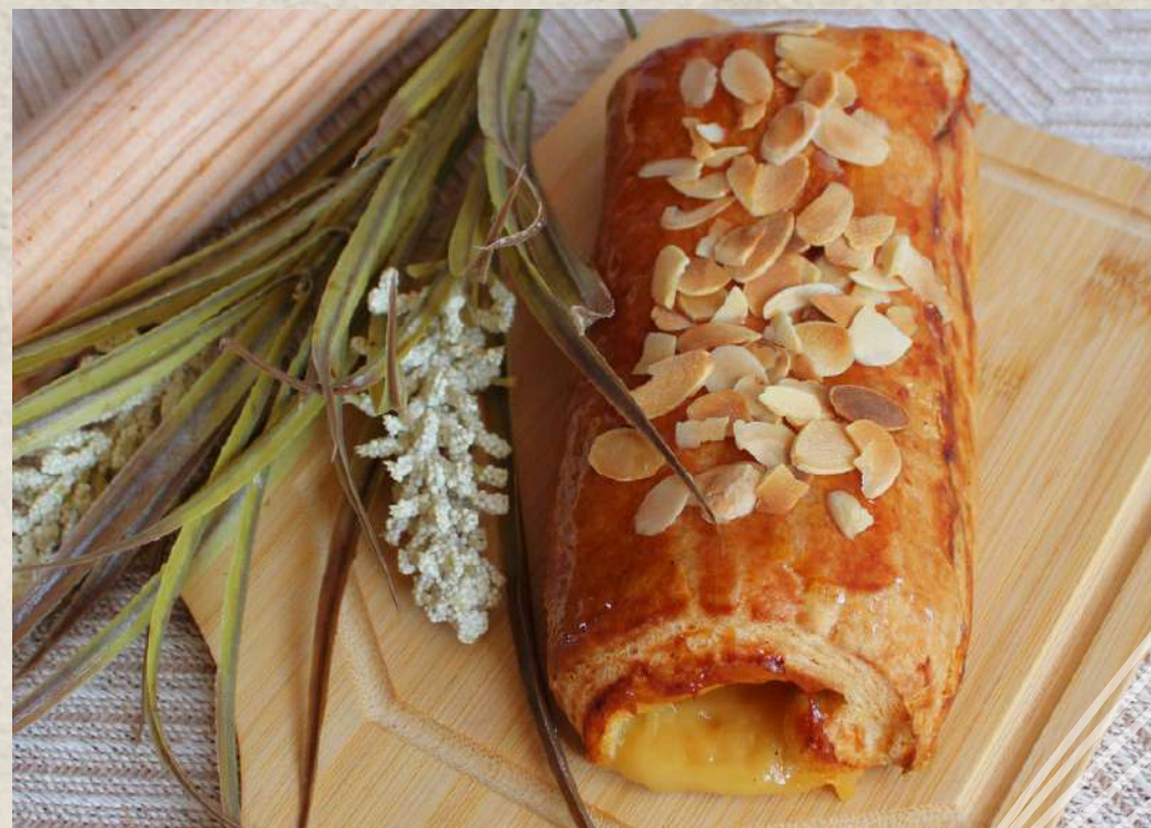
CAÑA DE CREMA COD. 209