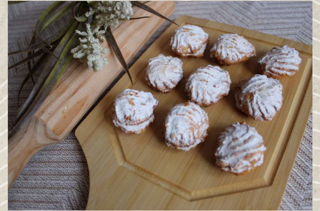
PASTAS TIPO 16 (BANDEJA 1 KG.)