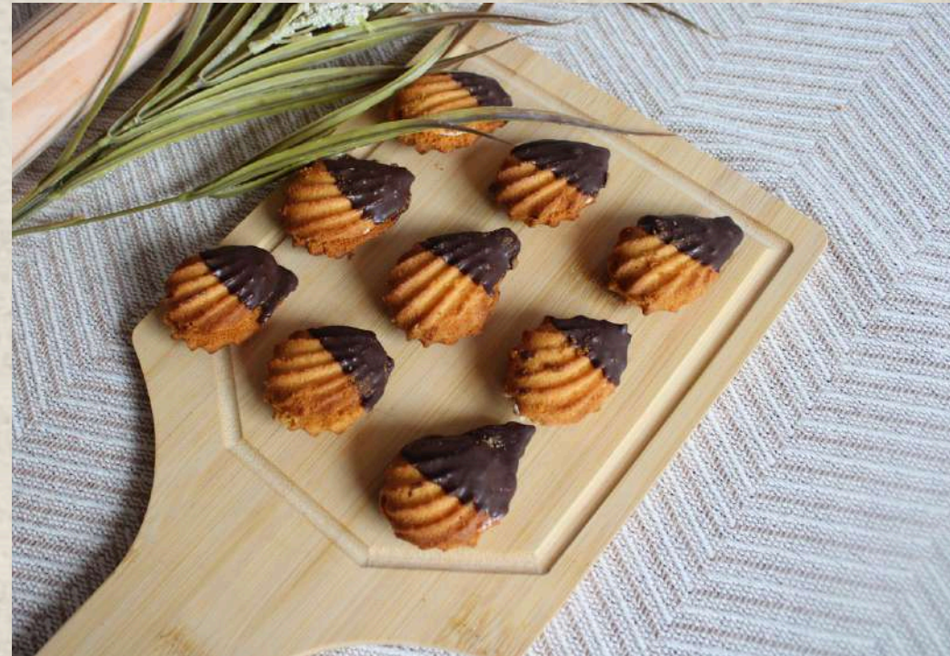
PASTAS TIPO 15 (BANDEJA 1 KG.)