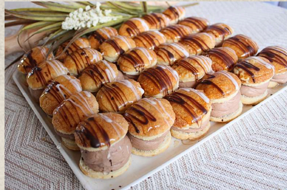
LAFONES DE TRUFA (BANDEJA)