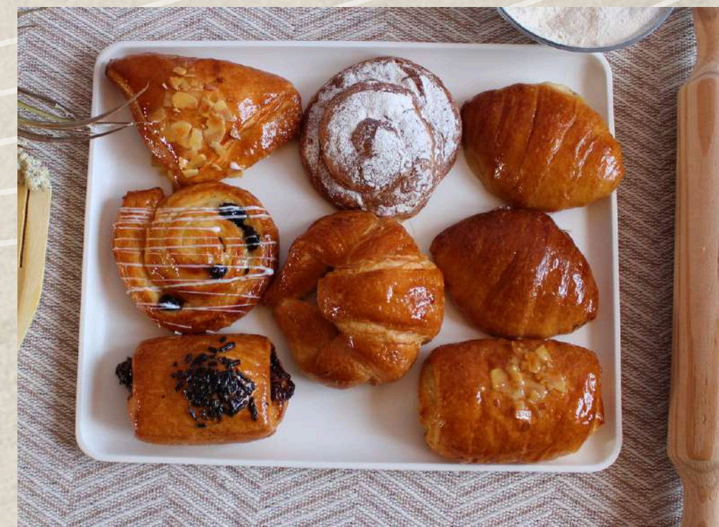
BOLLERÍA MINI COFFEE (1 KG)