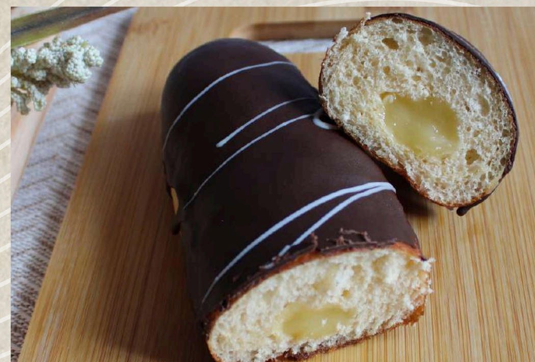
PEPITO CHOCOLATE COD. 117