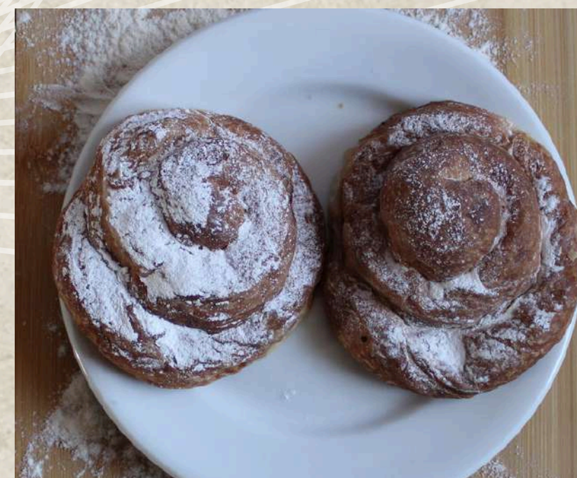
ENSAIMADAS MEDIANA CREMA COD. 172