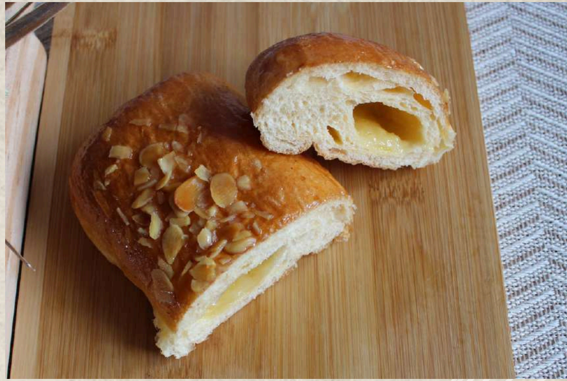
NAPOLITANA DE CREMA COD. 112