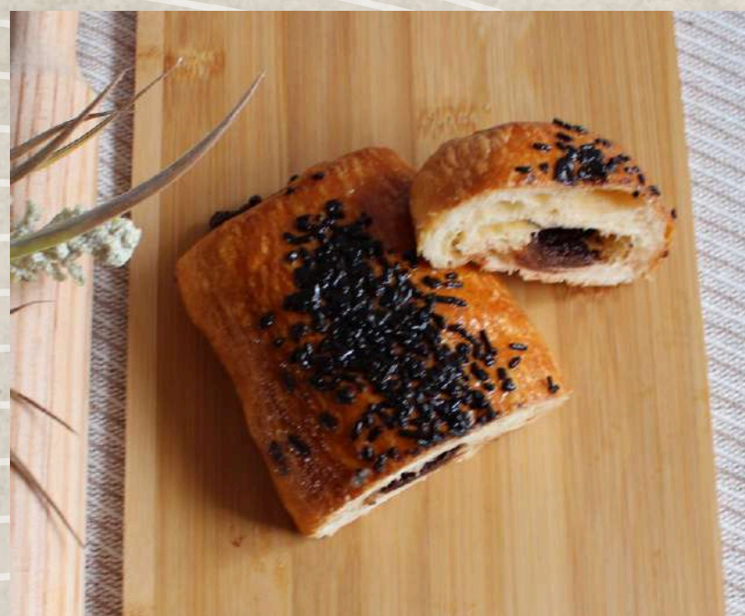
NAPOLITANA MEDIANA CHOCOLATE COD. 177