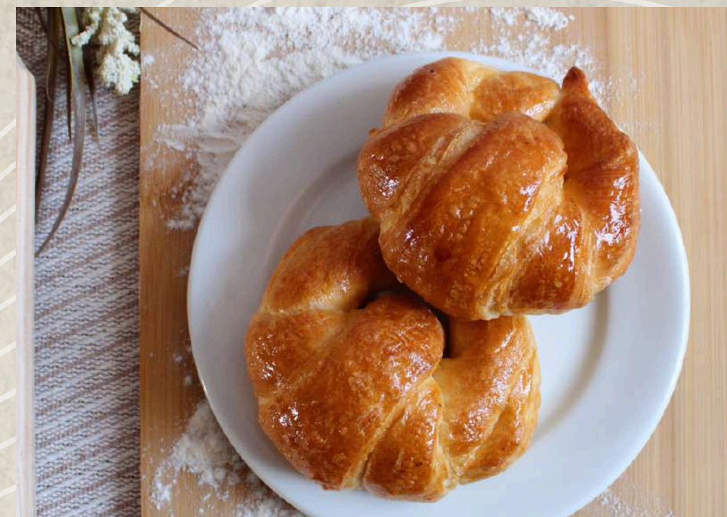
CROISSANT MINI CURVO CROISSANT MEDIANO CURVO COD. 0175