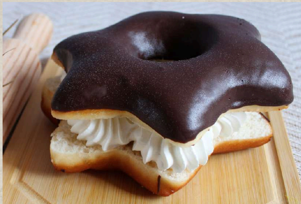
ESTRELLA CHOCOLATE Y NATA COD. 167