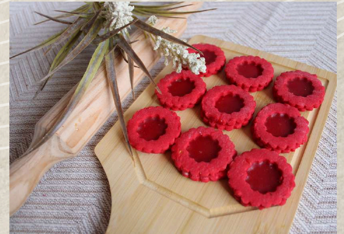
PASTAS TIPO 13 (BANDEJA 1 KG.)