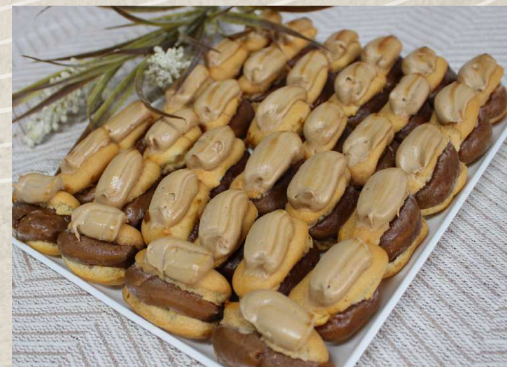
PETISÚ DE CAFÉ (BANDEJA)