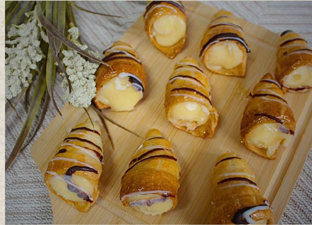
PASTELES CORNETES (BANDEJA) COD. 1334