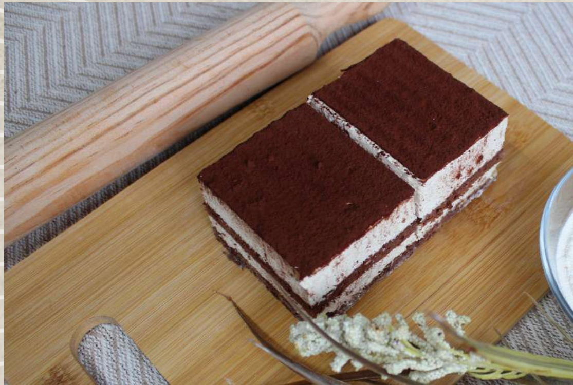
POSTRES DE TIRAMISÙ (BANDEJA 4 UD.)