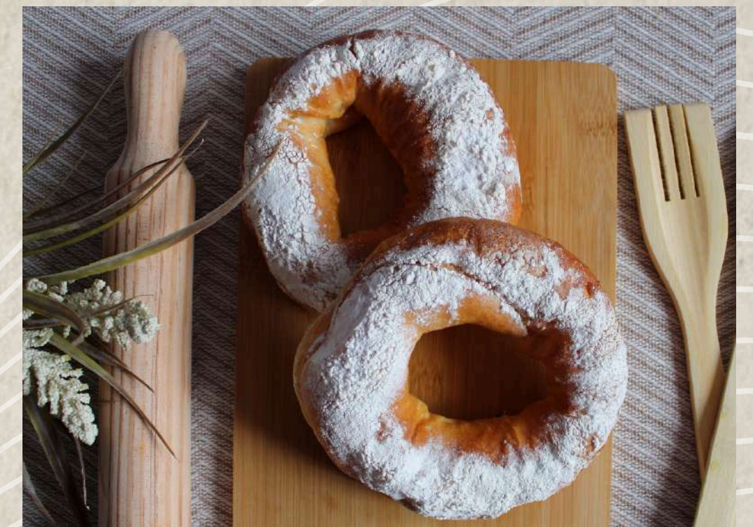
TORTELES DE LEVADURA