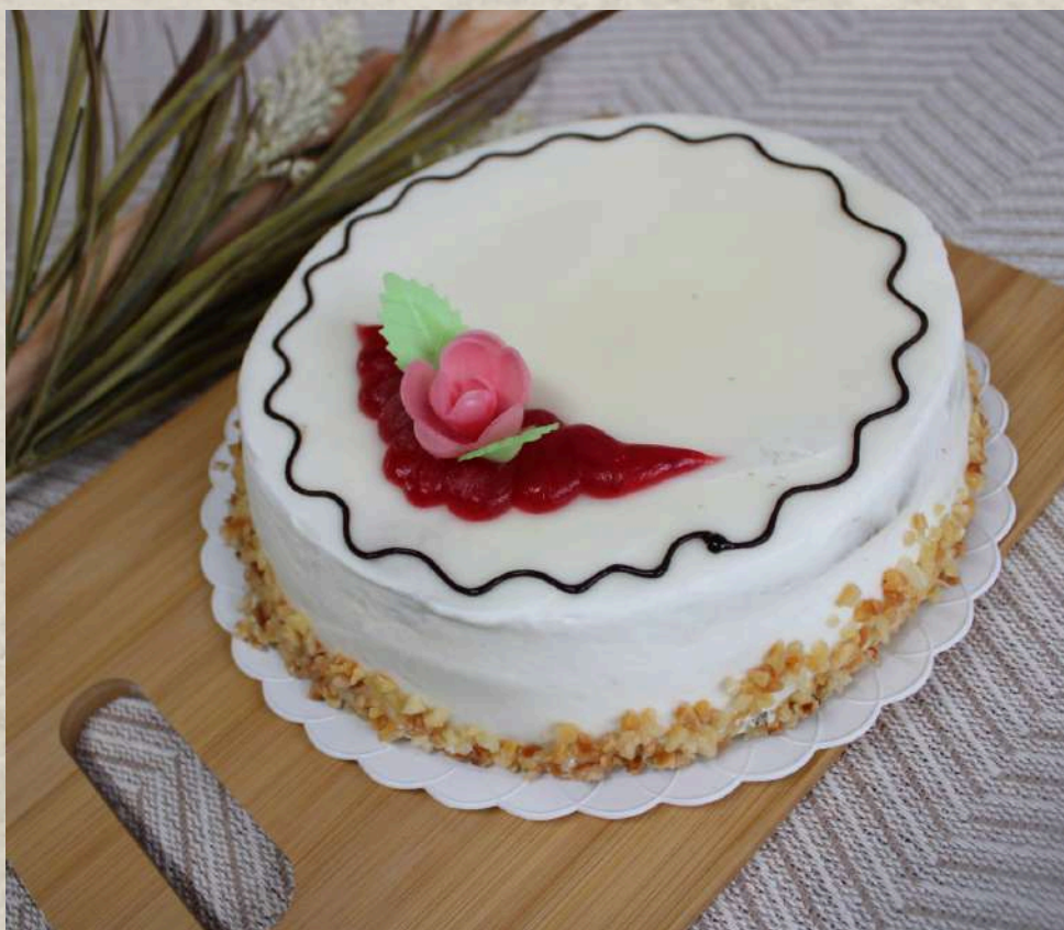
TARTA BOMBÓN BLANCO