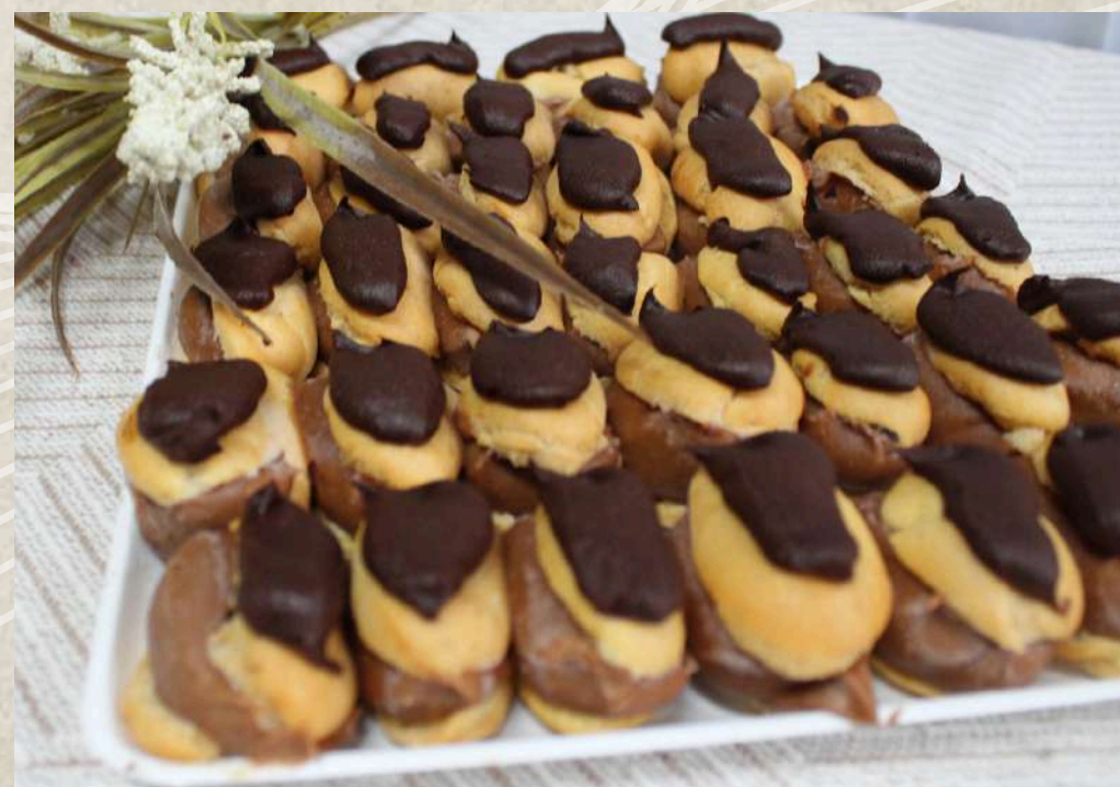
PETISÚ CHOCOLATE (BANDEJA)