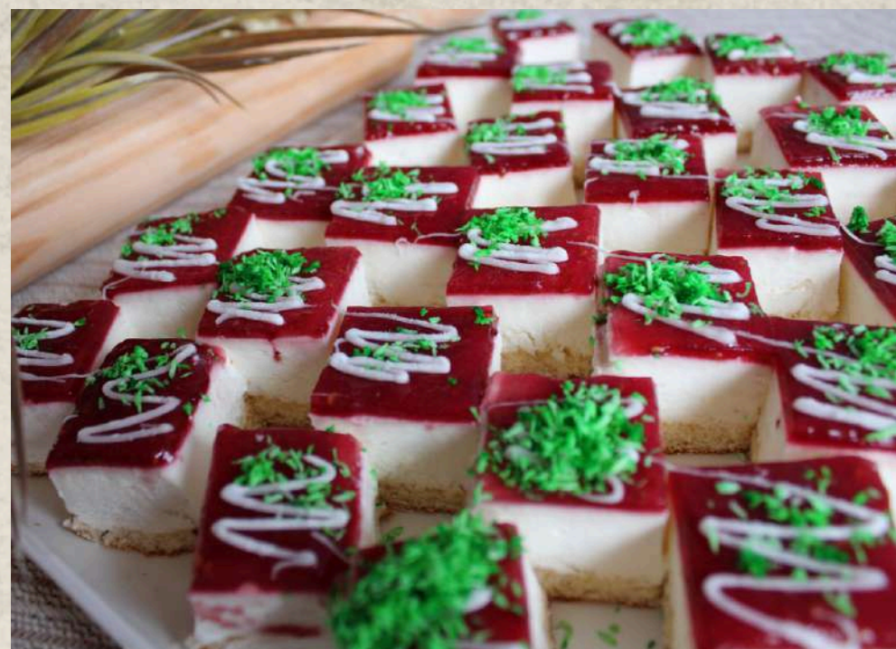
PASTELES QUESO Y FRAMBUESA (BANDEJA)