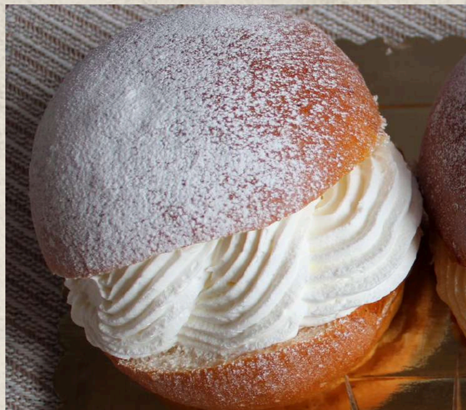
BAMBA NATA COD. 305