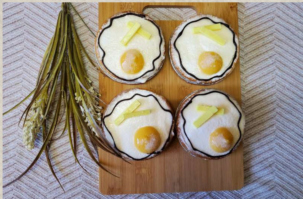
TARDALETAS "HUEVOS FRITOS CON PATATAS" (CON NATA, CREMA Y YEMA)