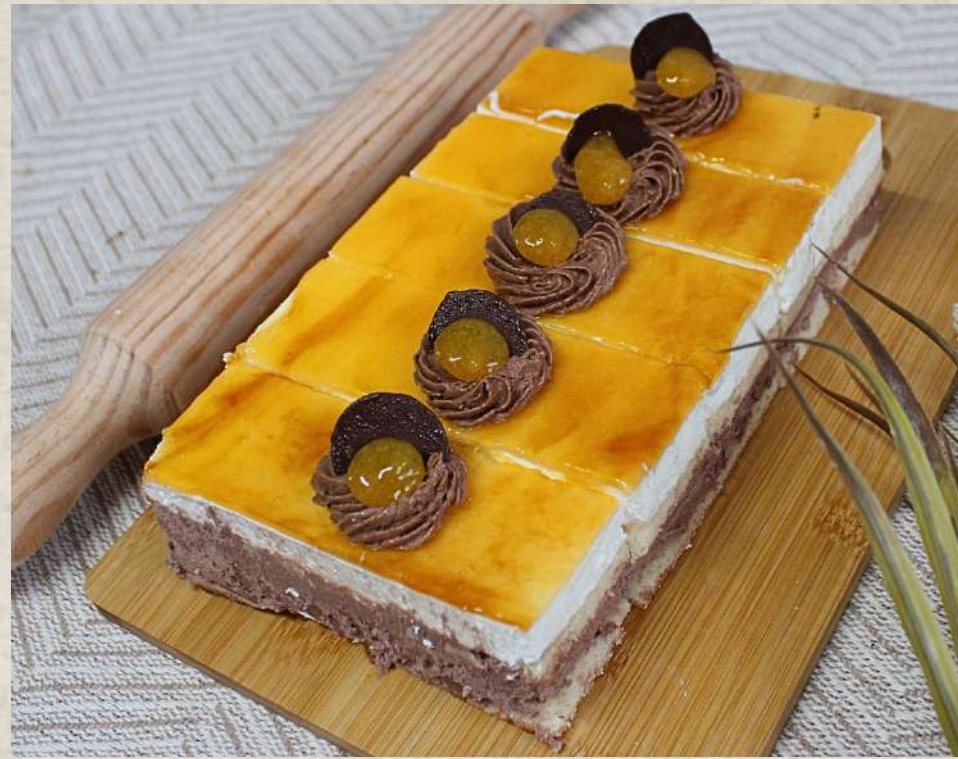
POSTRES SAN MARCOS (BANDEJA 5 UD.)