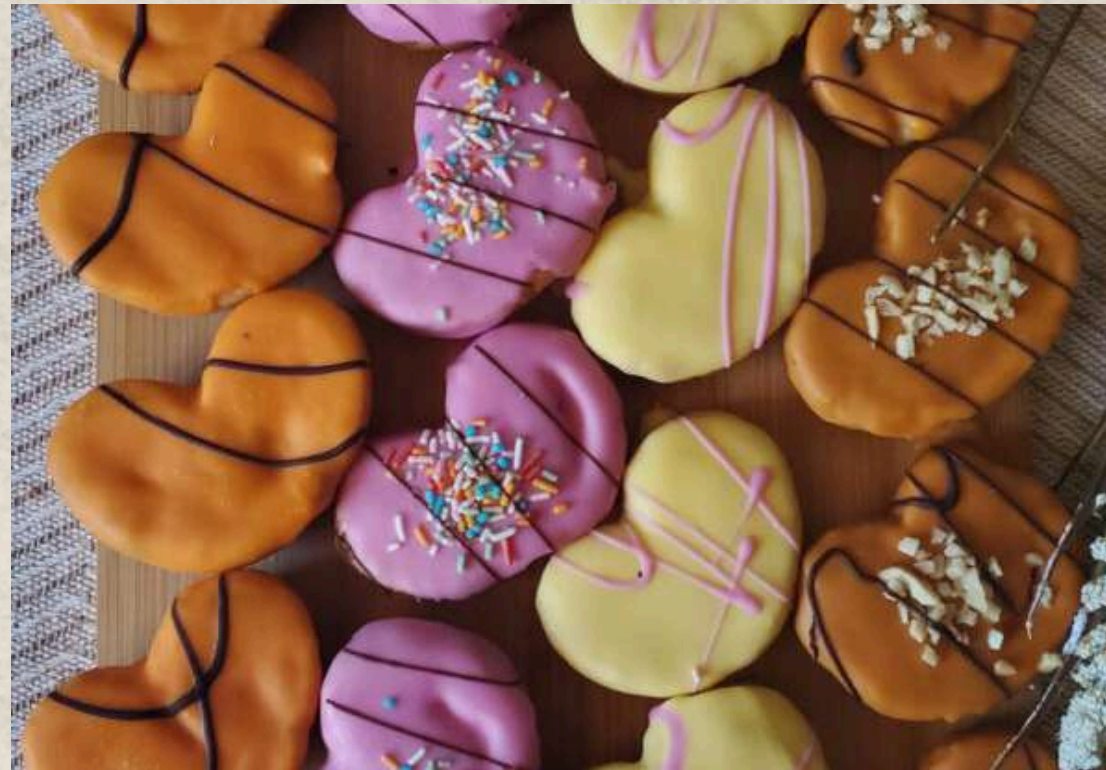
PALMERITAS ARTESANAS SURTIDAS CARAMELO, PLÁTANO, FRESA Y NARANJA. CAJA DE 20 UNIDADES COD. 2449