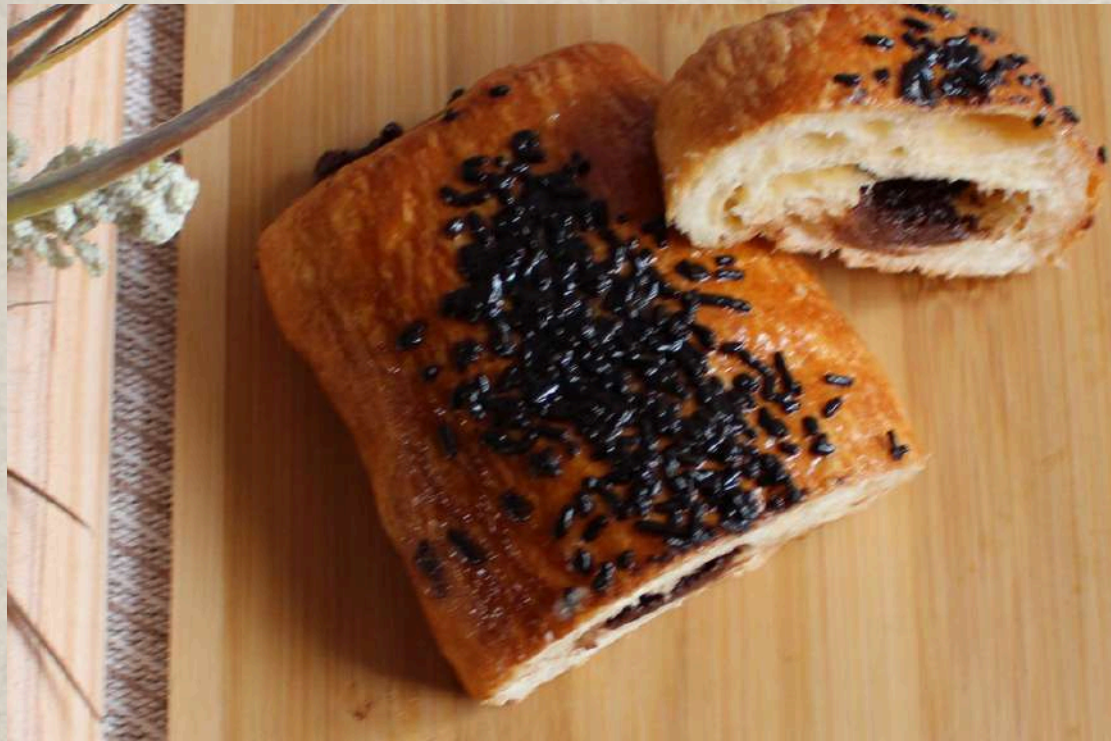
NAPOLITANA DE CHOCOLATE COD. 228