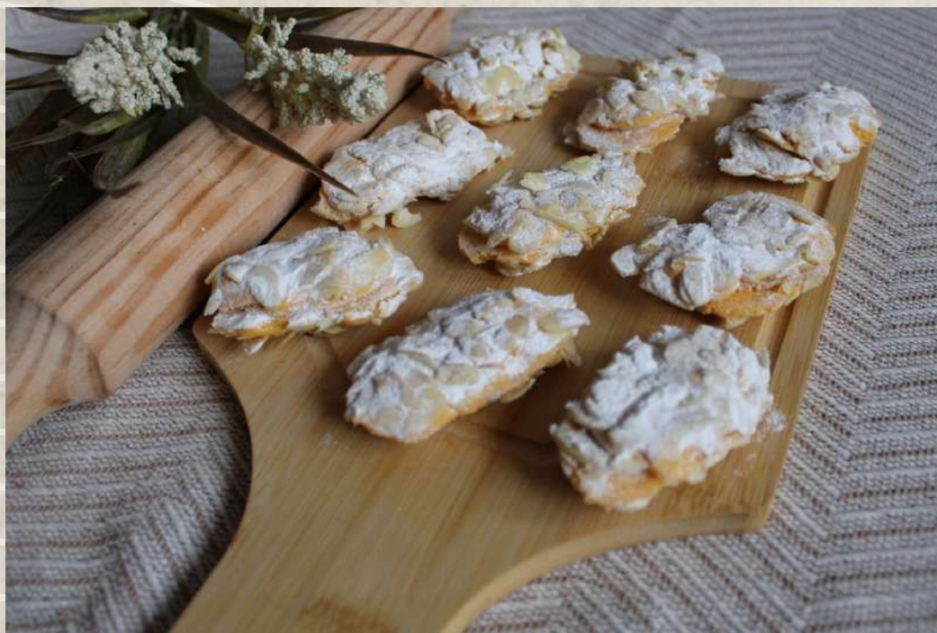
PASTAS TIPO 11 (BANDEJA 1 KG.)