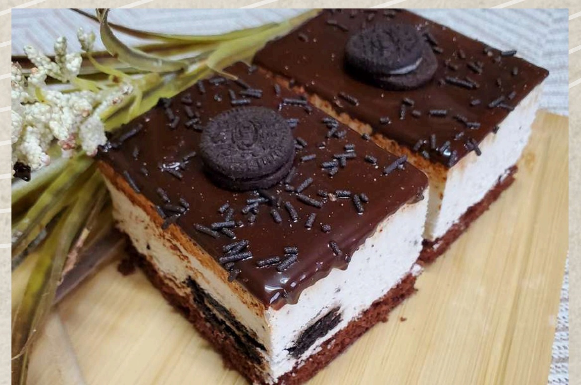
POSTRES DE OREO (BANDEJA 4 UD.)