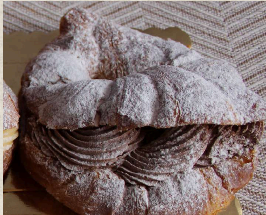
CROISSANT RELLENO TRUFA