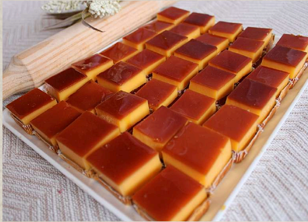
PASTELES FLANES (BANDEJA) COD. 1330