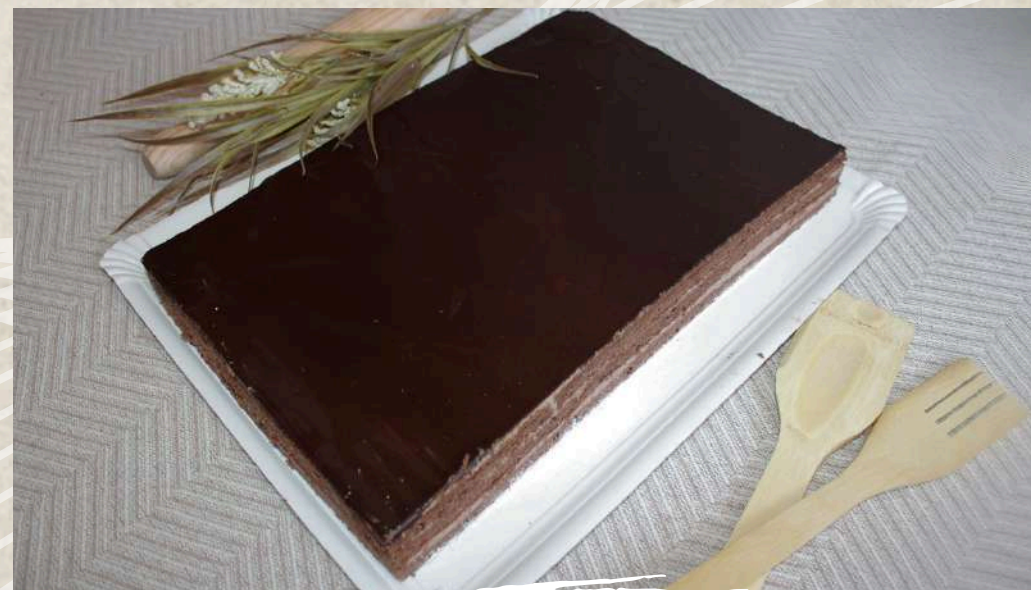
TARTA DE RESTAURANTE BOMBÓN COD. 0268