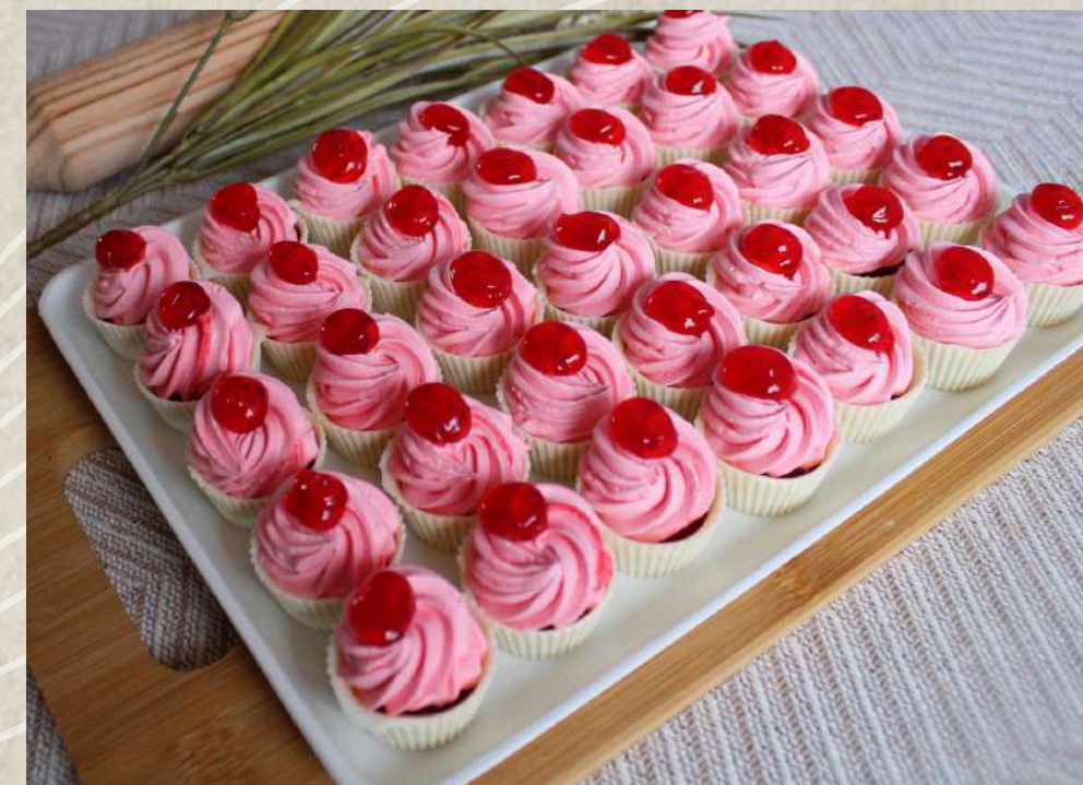
PETIFOURS FRESA (BANDEJA)