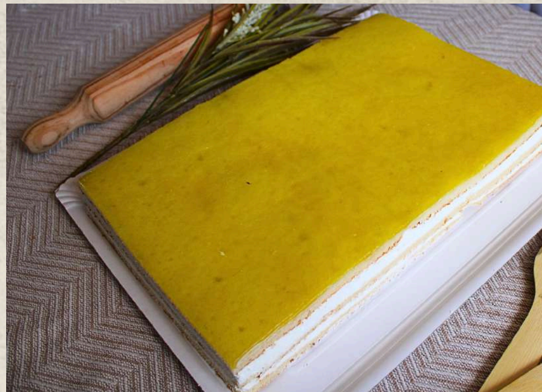
TARTA DE RESTAURANTE LIMÓN COD. 0265