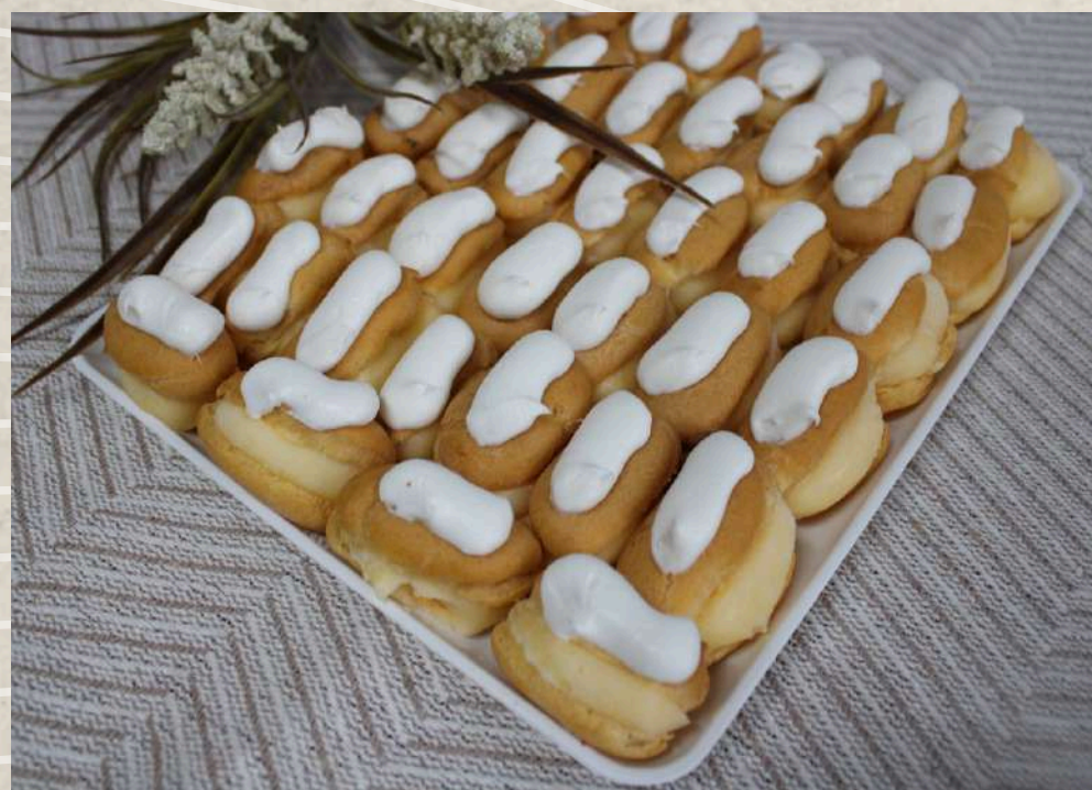
PETISÚ DE CREMA (BANDEJA)