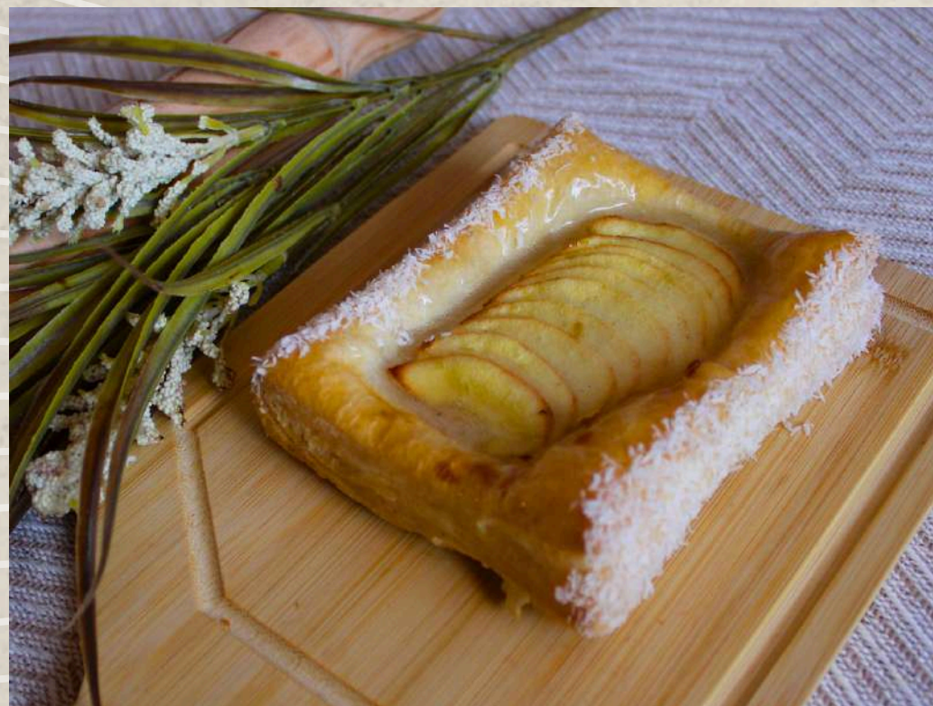
POSTRE DE MANZANA