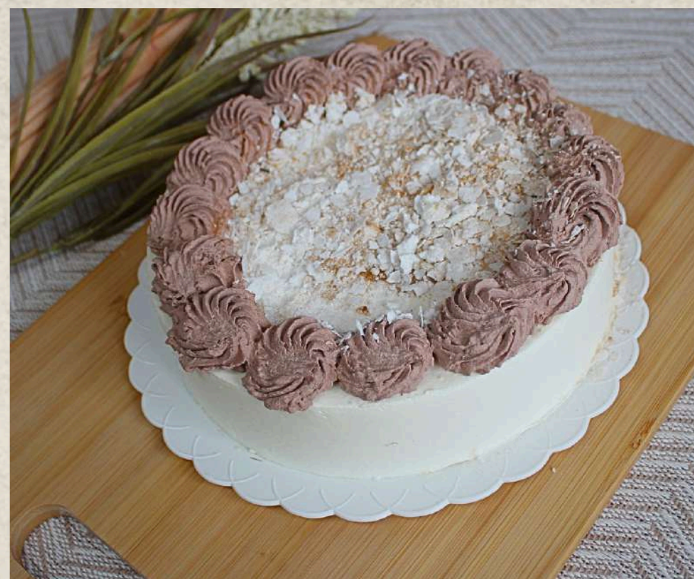
TARTA SELVA BLANCA