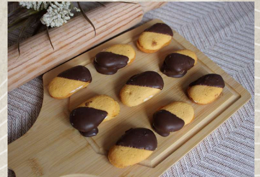
PASTAS TIPO 10 (BANDEJA 1 KG.)