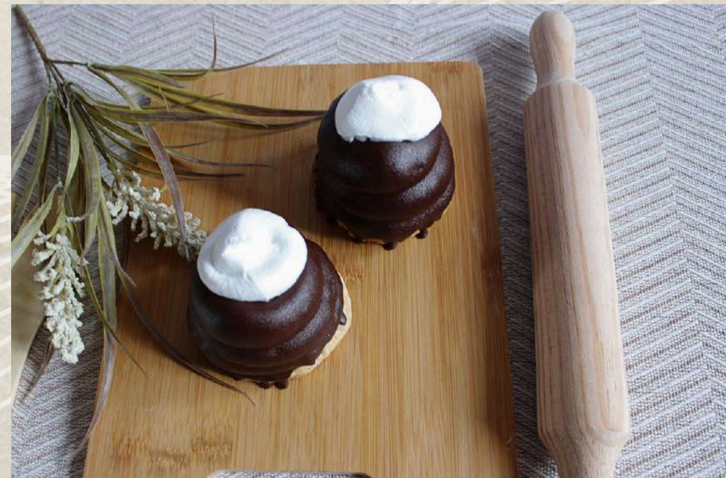
NEGRITO DE MERENGUE