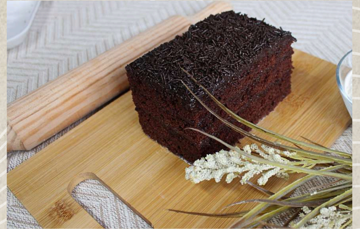
POSTRES DE CHOCOLATE BRIGADEIRO (BANDEJA 4 UD.)