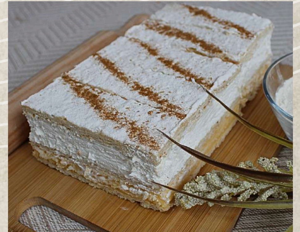
POSTRE MILHOJAS NATA Y CREMA (BANDEJA 5 UD.)