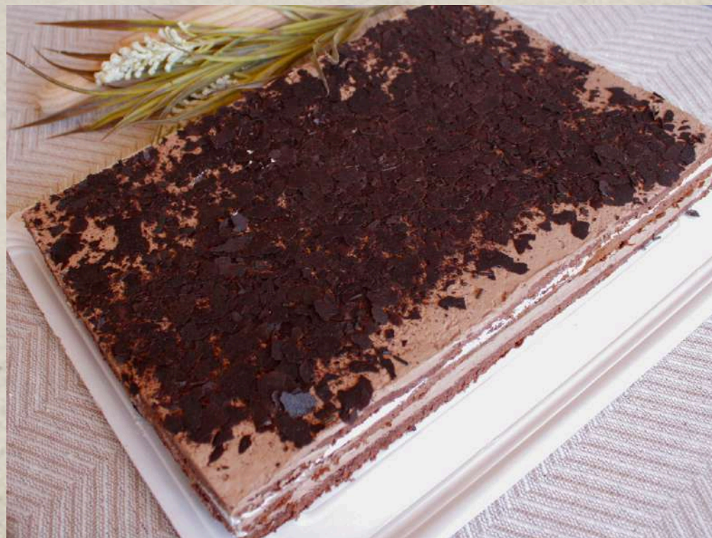
TARTA DE RESTAURANTE SELVA NEGRA COD. 0270