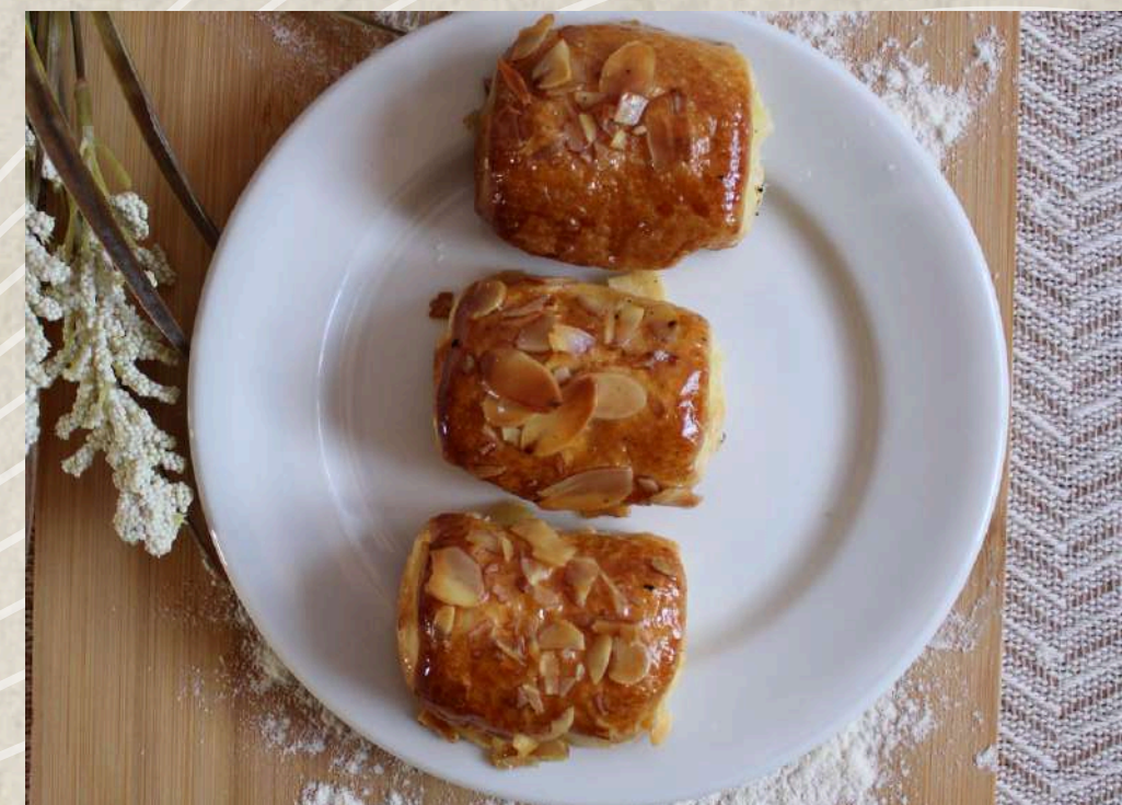
NAPOLITANA CREMA MINI