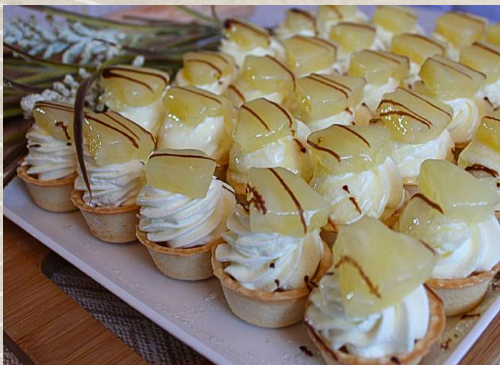
TARDALETAS PIÑA (BANDEJA)