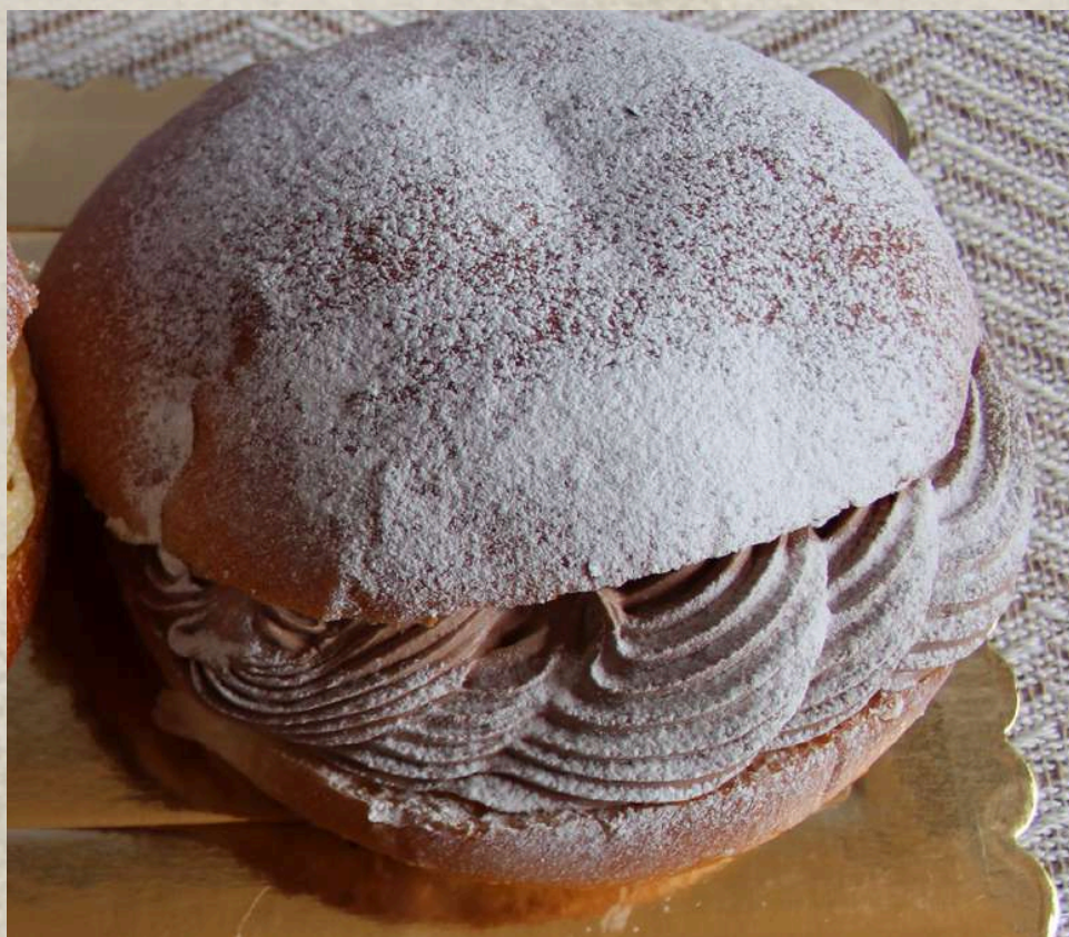
BAMBA TRUFA COD. 307