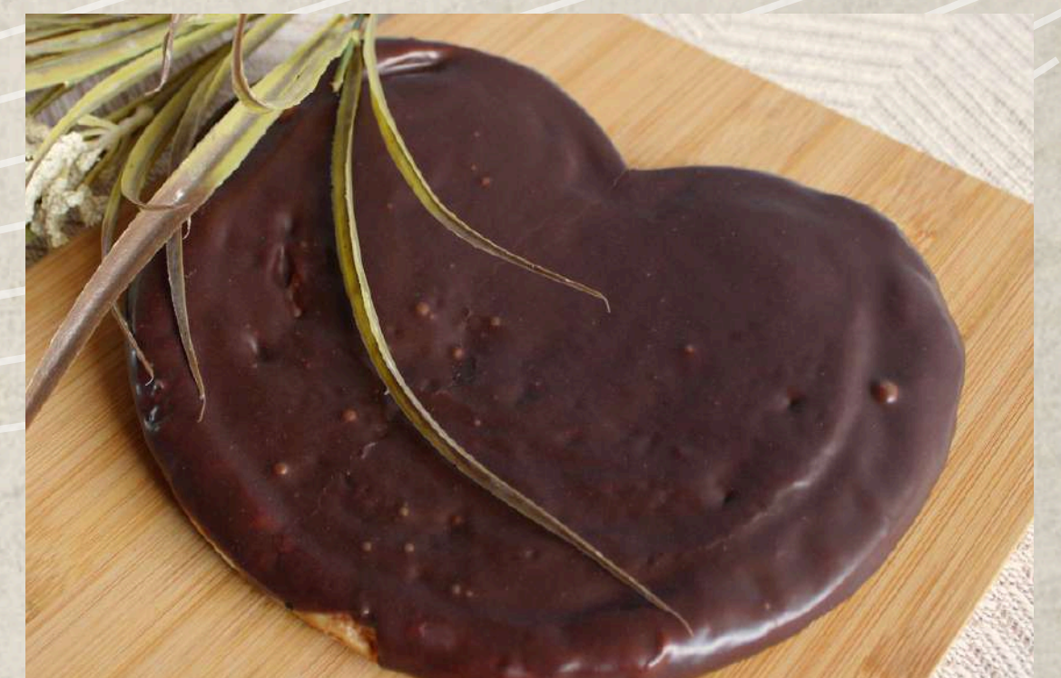
PALMERA DE BOMBÓN COD. 216