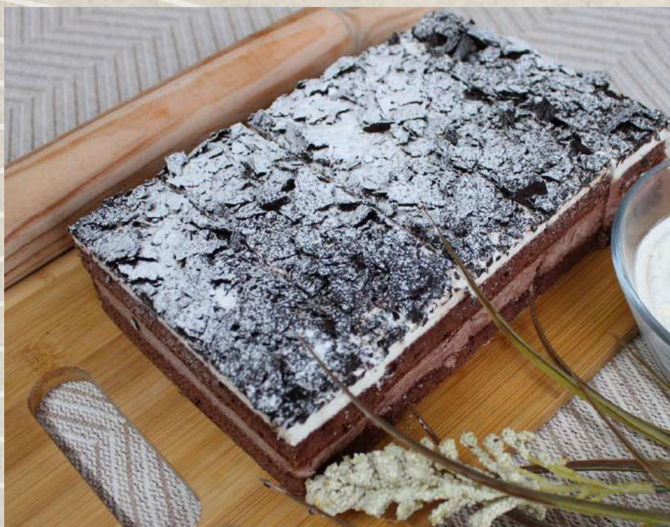
POSTRES SELVA NEGRA (BANDEJA 5 UN.)