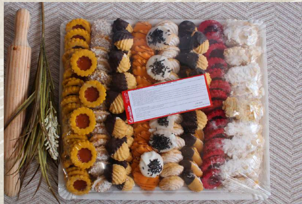
PASTAS FINAS VARIADAS (BANDEJA DE 2 KG)