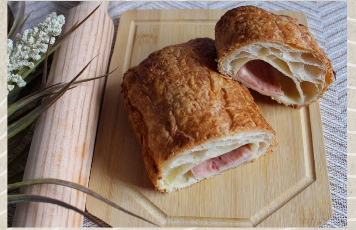
NAPOLITANA JAMÓN Y QUESO COD. 5514