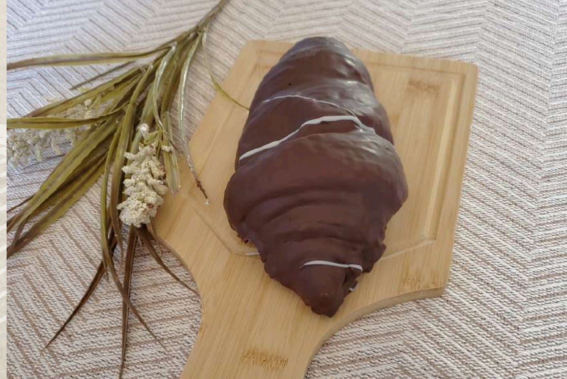
CORNETES DE CHOCOLATE