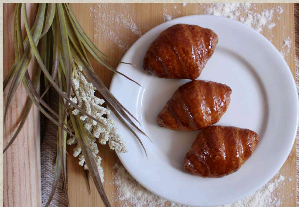
CROISSANT MINI RECTO