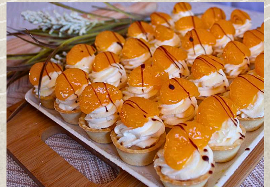
TARDALETAS DE MANDARINA (BANDEJA)