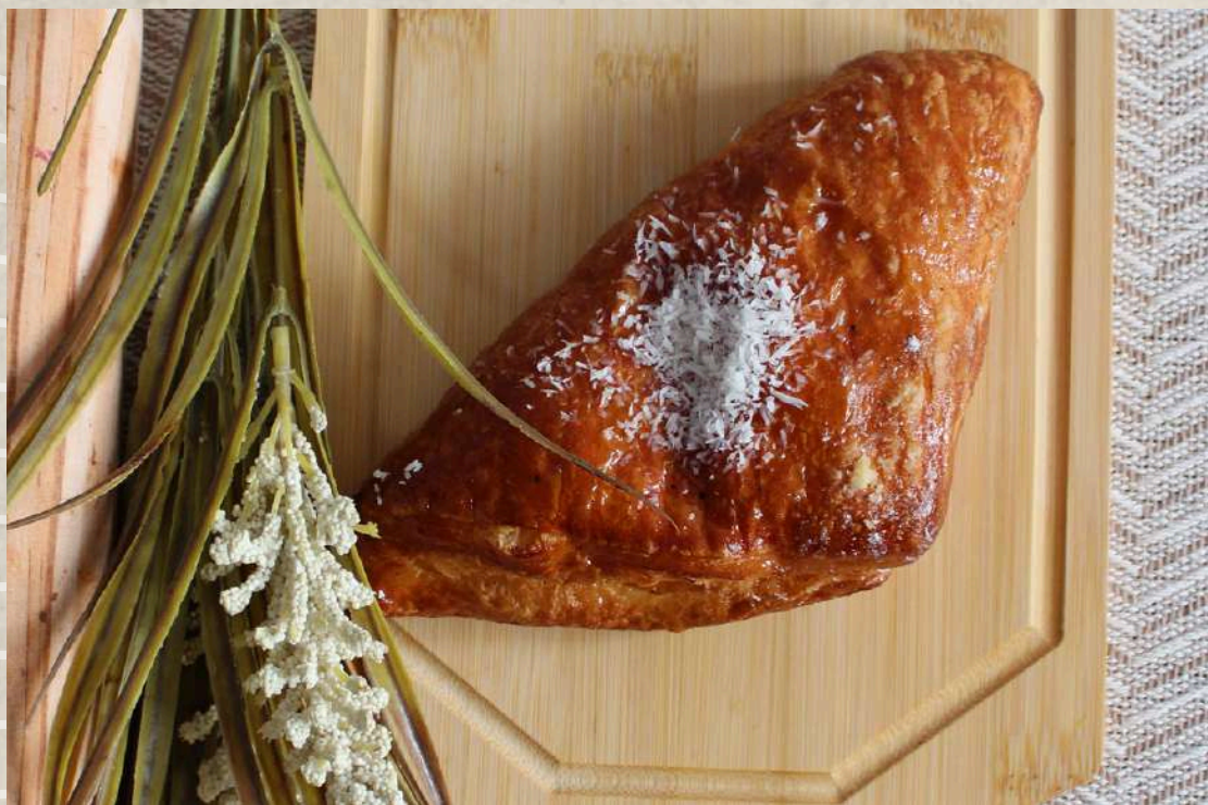
PAÑUELOS DE CREMA COD. 138