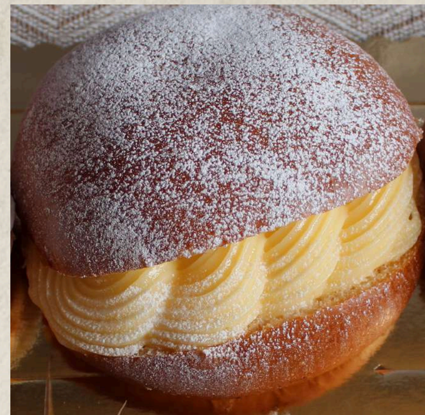
BAMBA CREMA COD. 304