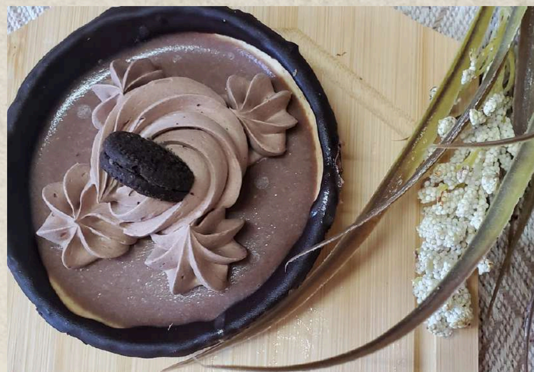
TARTELETA DE TRUFA