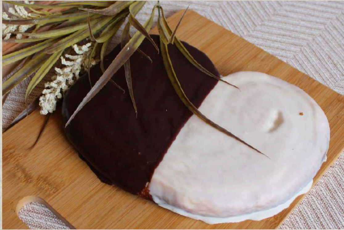
PALMERA DOS CHOCOLATES COD. 223