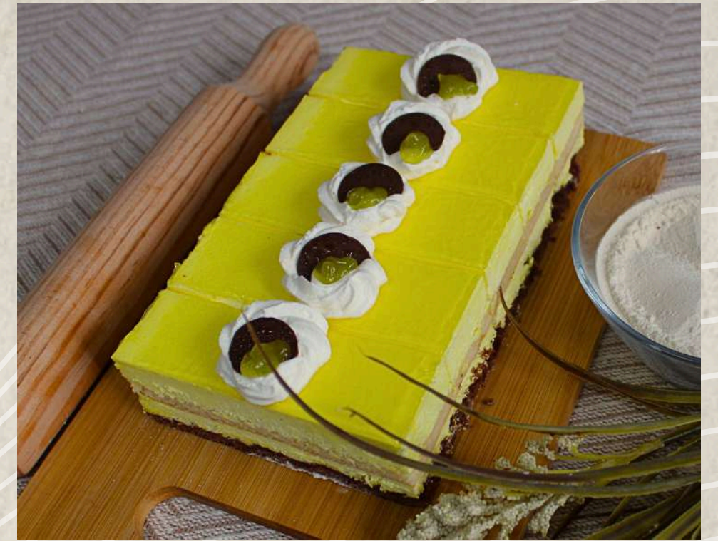
POSTRES MOUSSE LIMÓN (BANDEJA 5 UD.)