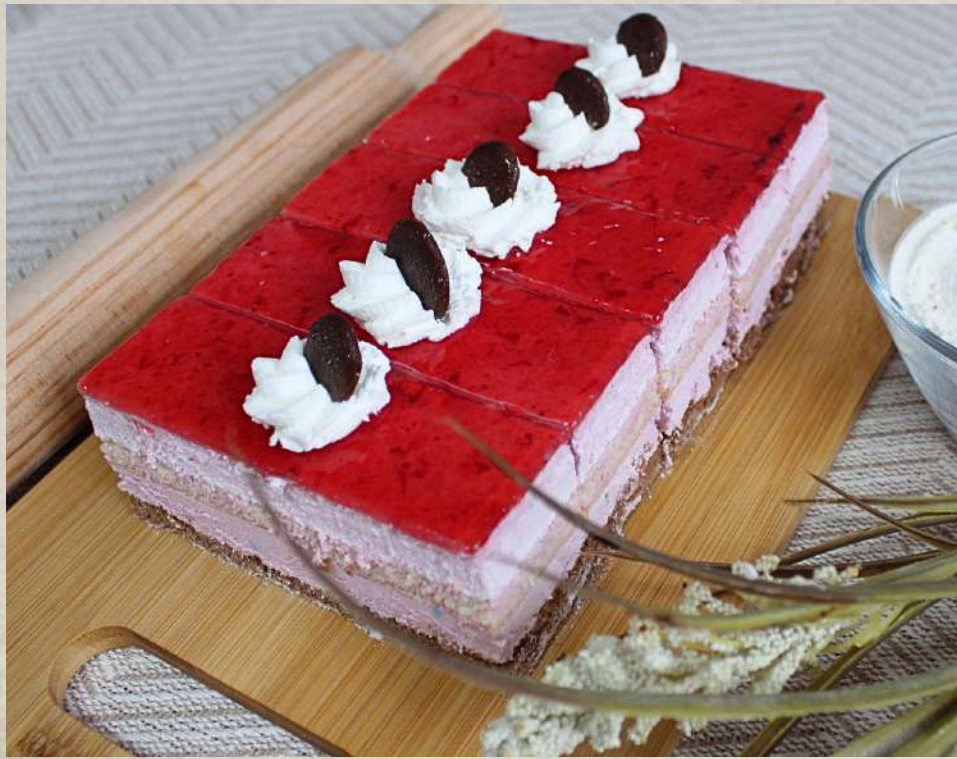
POSTRES MOUSSE FRESA (BANDEJA 5 UD.)