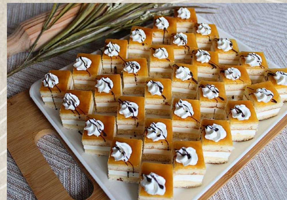
PASTELES SAN MARCOS (BANDEJA)