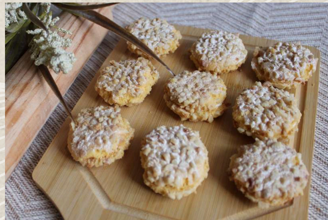
PASTAS TIPO 12 (BANDEJA 1 KG.)