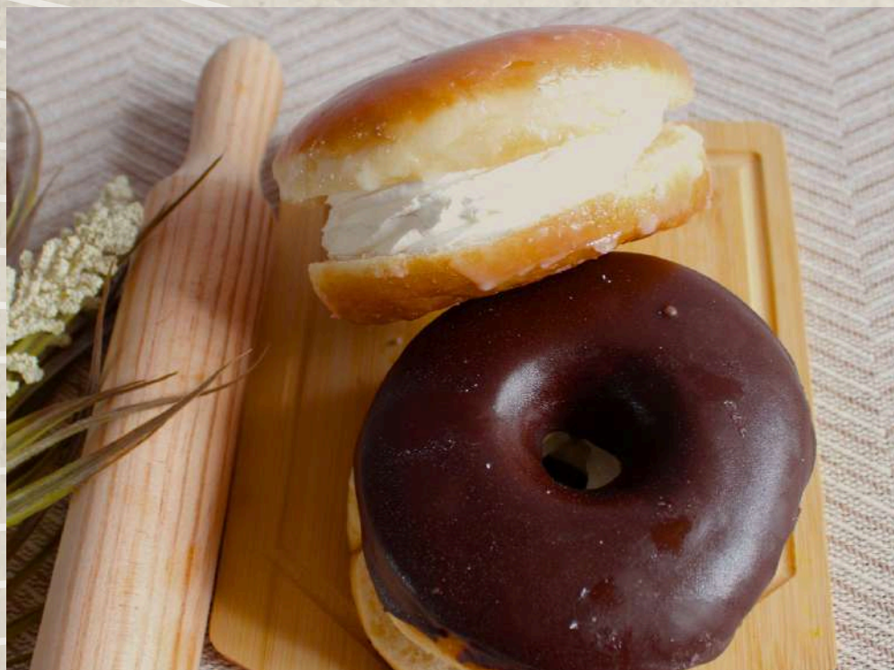
BERLINAS DE AZÚCAR O CHOCOLATE RRELENAS DE NATA