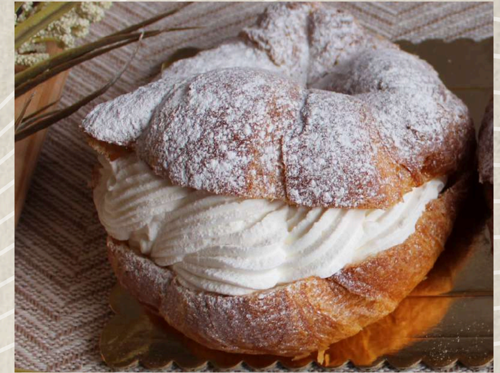
CROISSANT RELLENO NATA