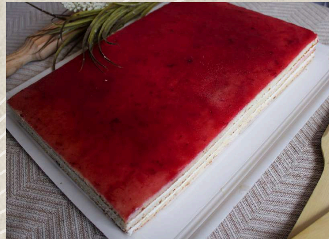
TARTA DE RESTAURANTE FRESA COD. 0261