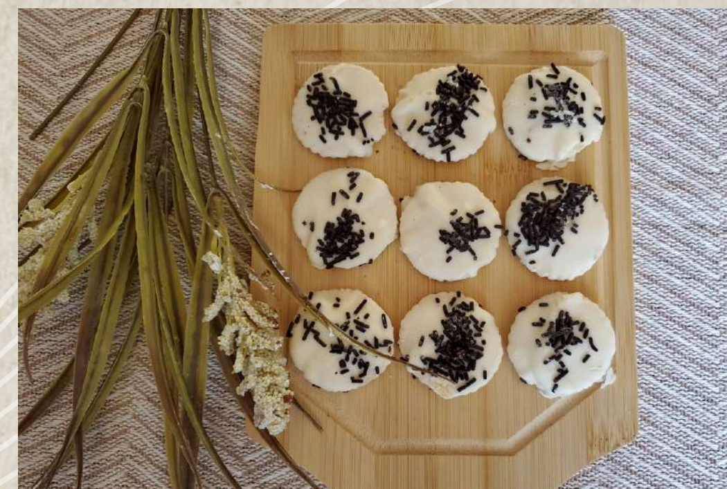
PASTAS TIPO 3 (BANDEJA 1 KG.)