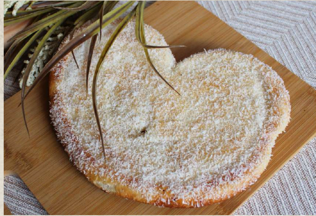
PALMERA DE COCO COD. 200