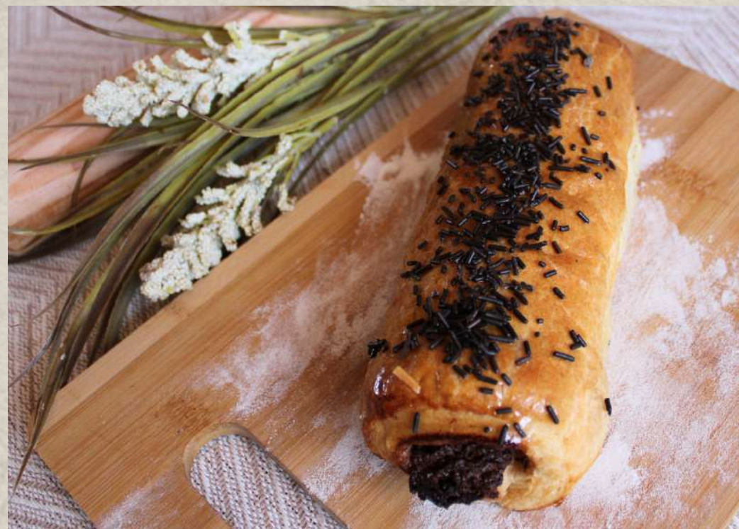
CAÑA DE CHOCOLATE COD. 211