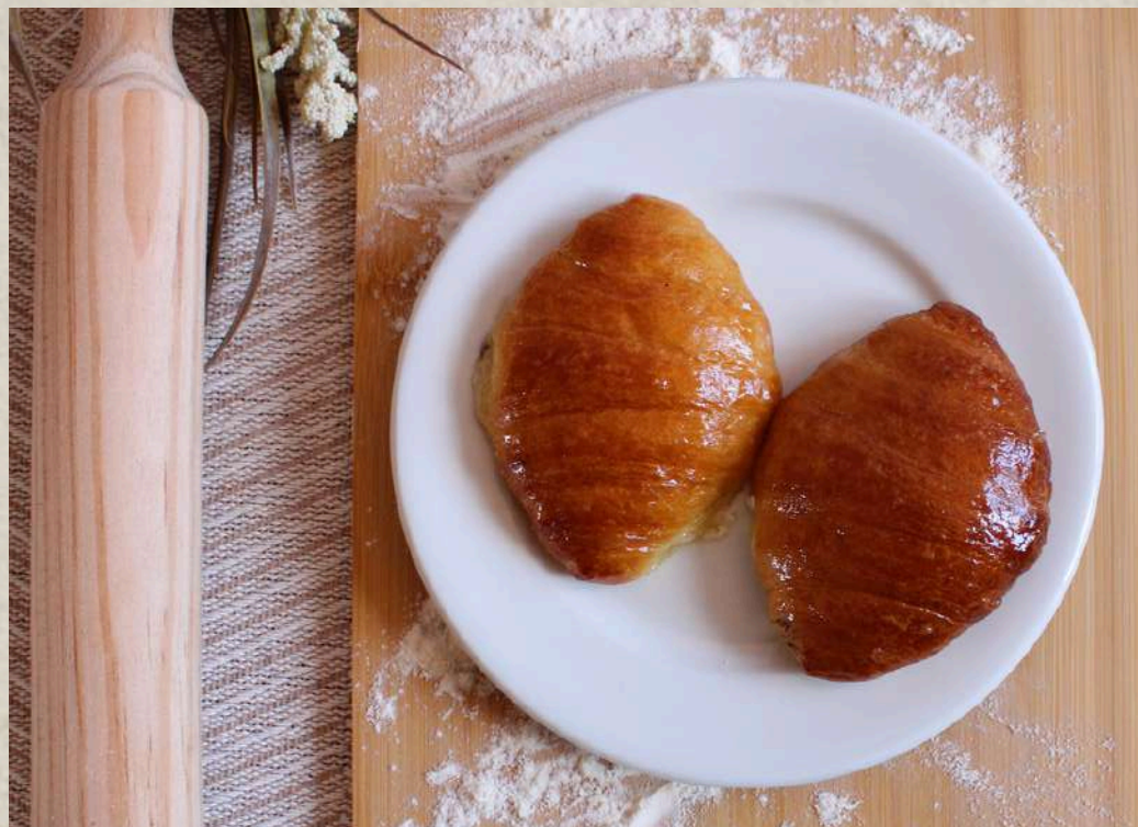
CROISSANT MEDIANO RECTO COD. 179