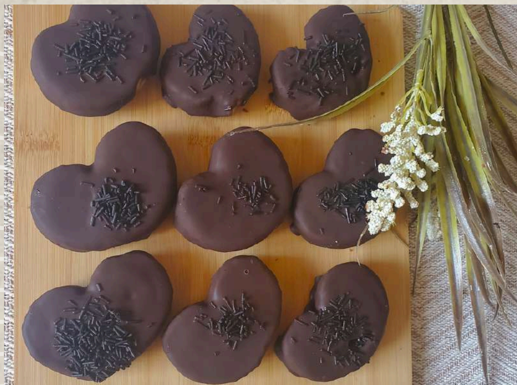
PALMERITAS ARTESANAS CHOCOLATE CAJA DE 20 UNIDADES COD. 2459