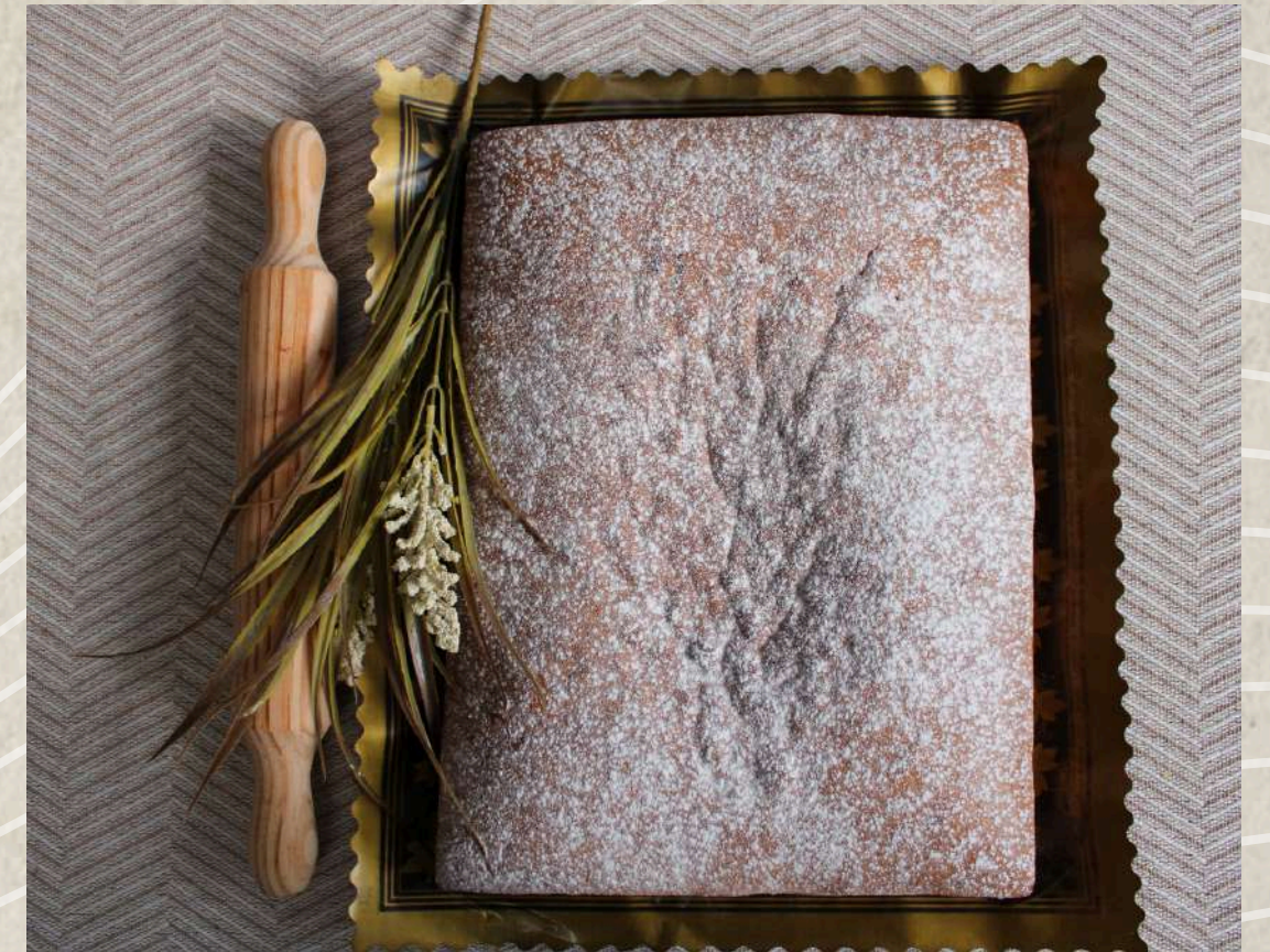
BIZCOCHO DE YOGUR