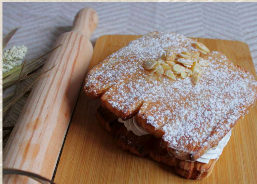
CRUNIS DE NATA COD. 205