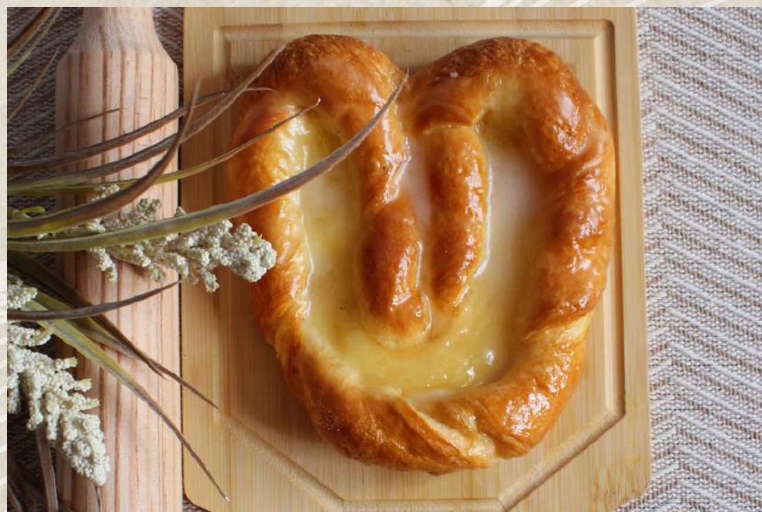
OREJA COD. 114