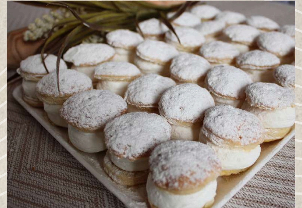
LAFONES DE NATA (BANDEJA)