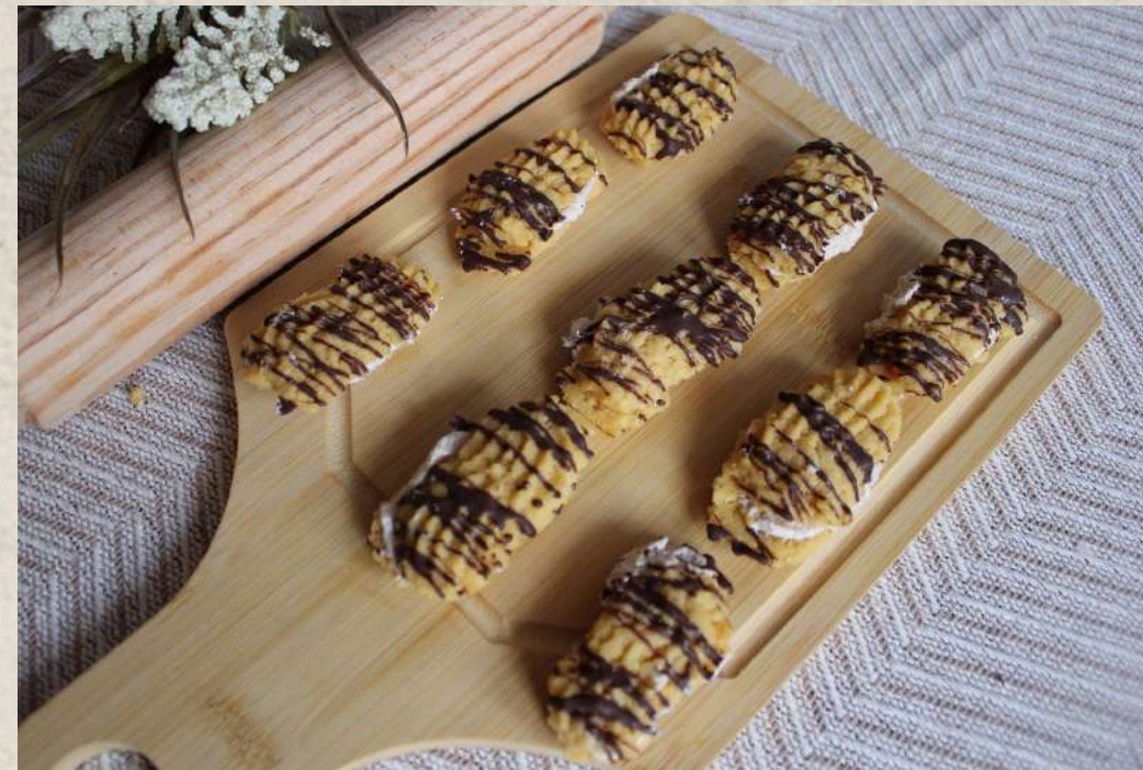
PASTAS TIPO 9 (BANDEJA 1 KG.)