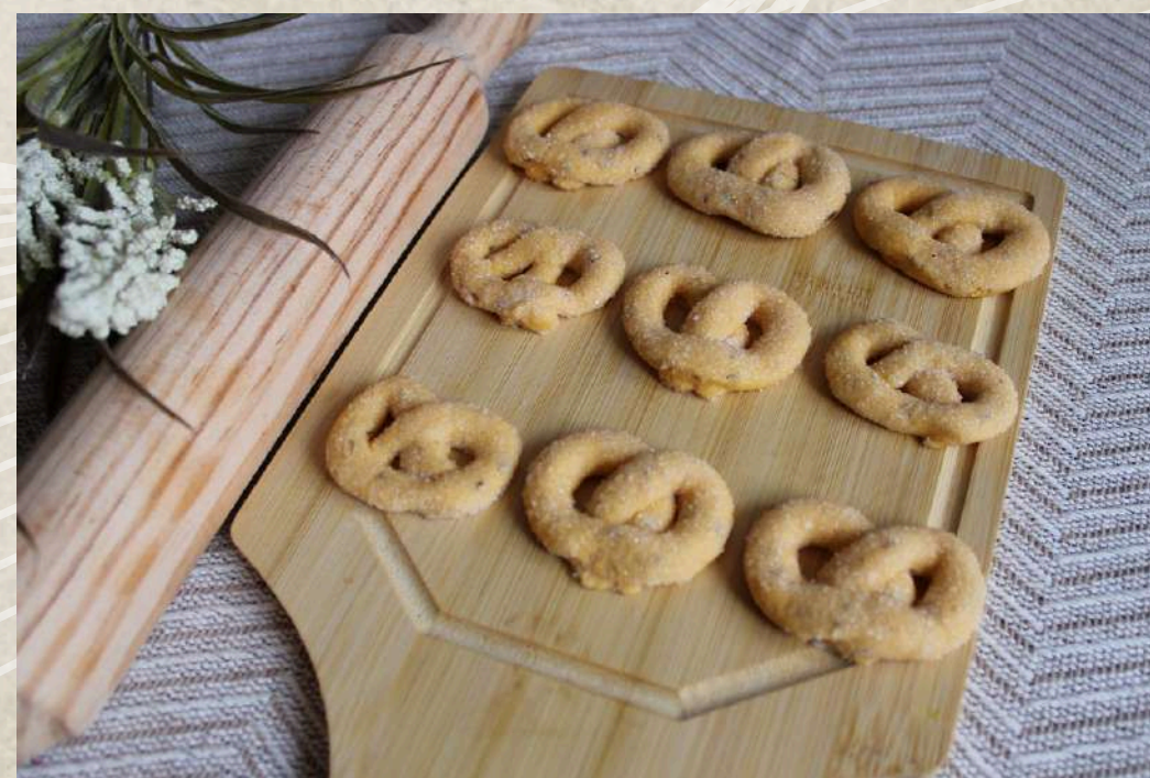
PASTAS TIPO 6 (BANDEJA 1 KG.)