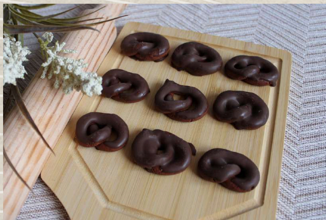
PASTAS TIPO 5 (BANDEJA 1 KG.)