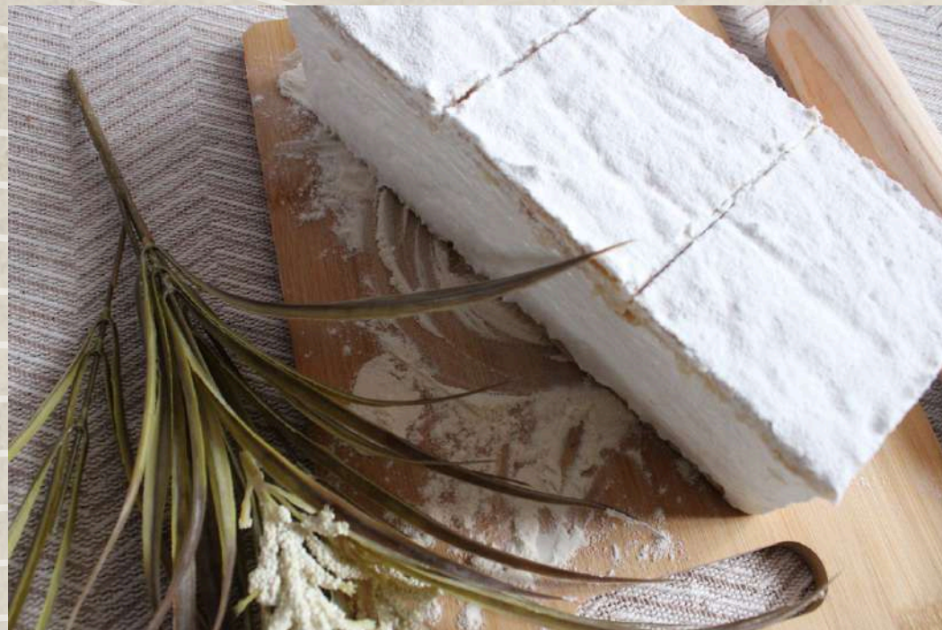
MILHOJAS DE MERENGUE (BANDEJA 6 UD.)