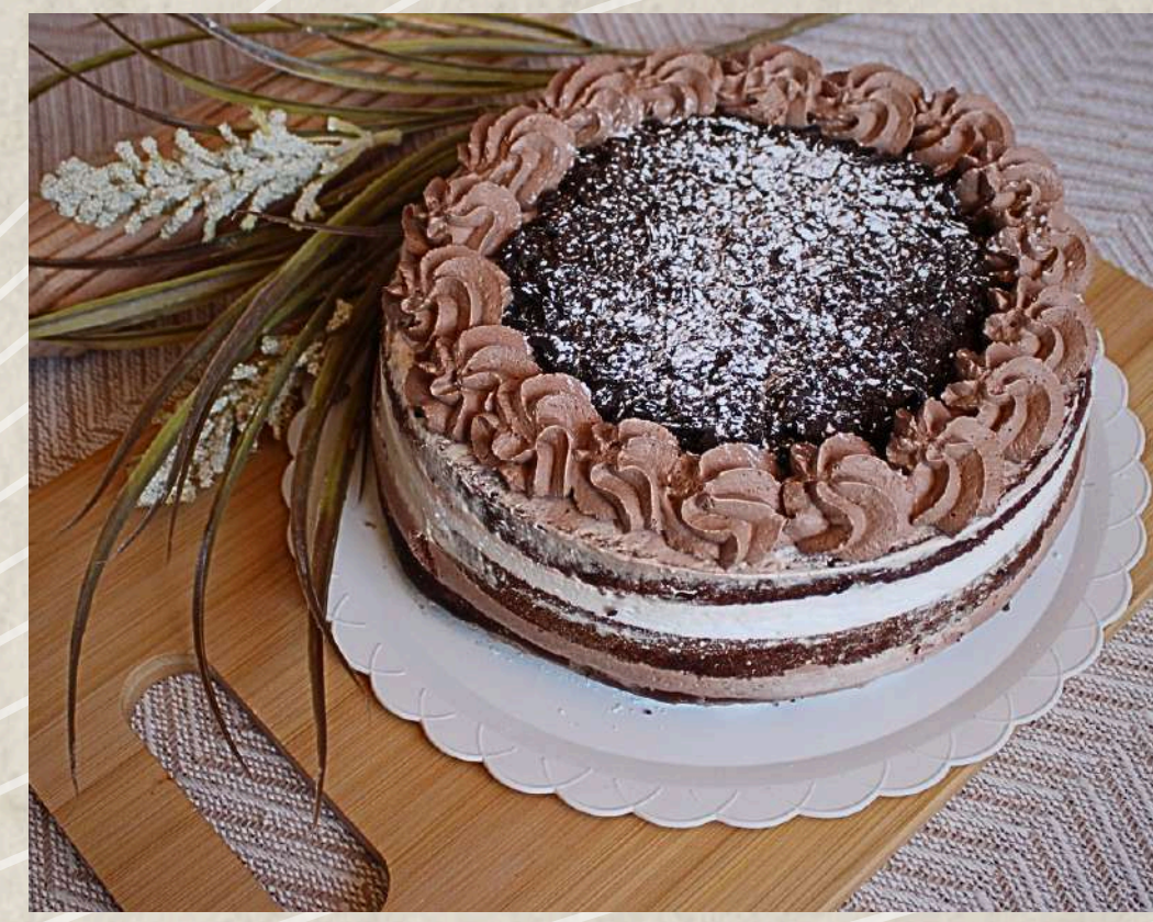
TARTA SELVA NEGRA