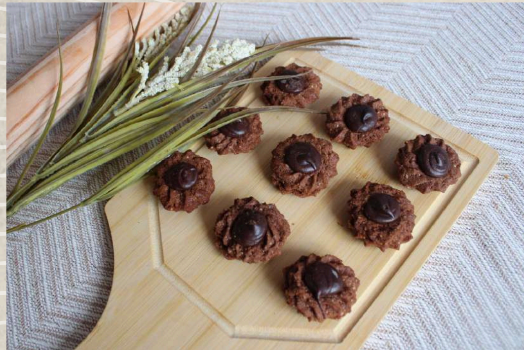
PASTAS TIPO 18 (BANDEJA 1 KG.)