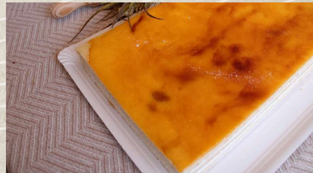
TARTA DE RESTAURANTE SAN MARCOS COD. 0264