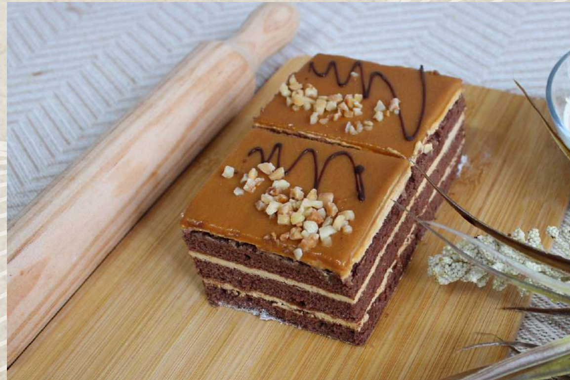
POSTRES DULCE DE LECHE (BANDEJA 4 UD.)