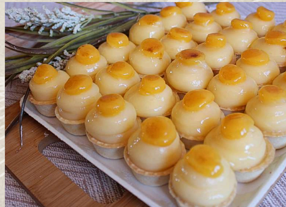
TARDALETAS CREMA (BANDEJA)